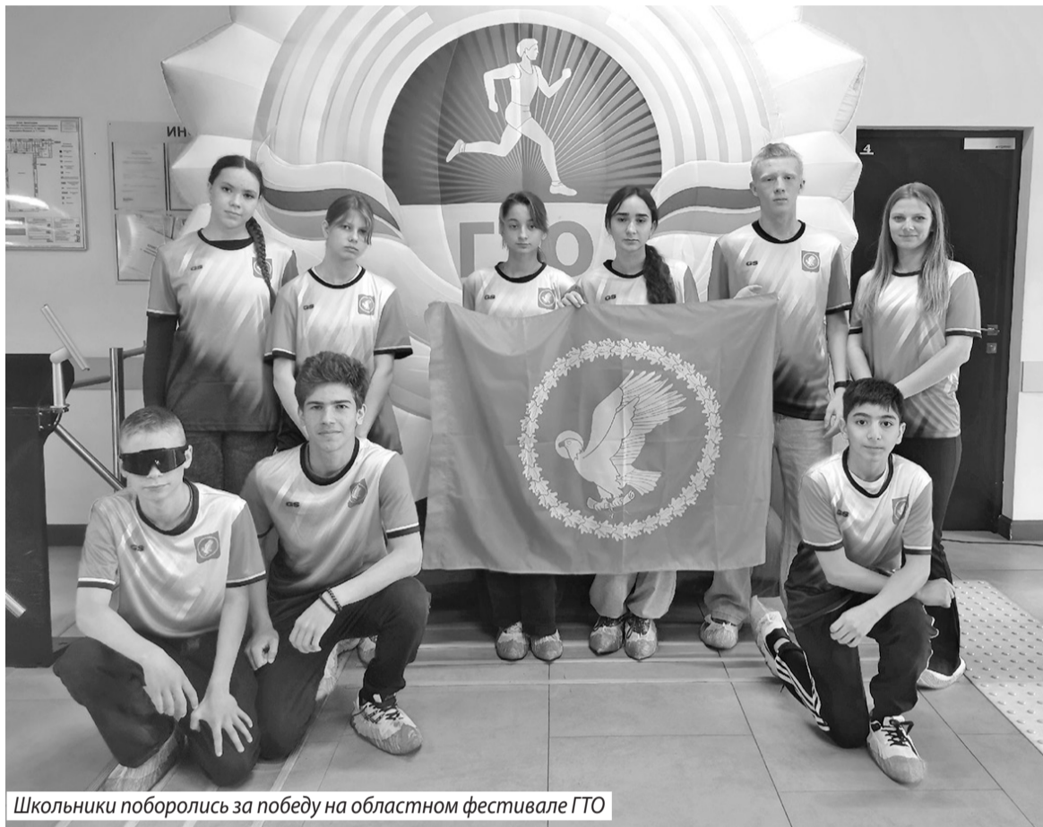
Школьники поборолась за победу на областном фестивале ГТО

Отметим и еще одно событие, касающееся «Движения Первых». Так, недавно ВДНХ стала главной точкой притяжения для детей и взрослых со всей России. Здесь собрались более двух тысяч человек