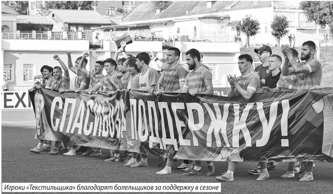
Игроки «Текстильщика» благодарят болельщиков за поддержку в сезоне