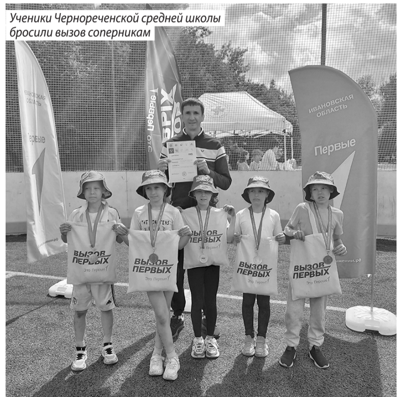
Ученики Чернореченской средней школы бросили вызов соперникам

Алена КОРОЛЕВА Фото участников конкурсов и соревнований