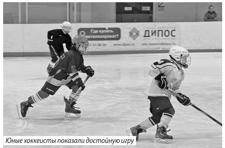
Юные хоккеисты показали достойную игру

Коллективы Ивановского округа приняли в фестивале активное участие. Так, в номинации «Народная хореография»