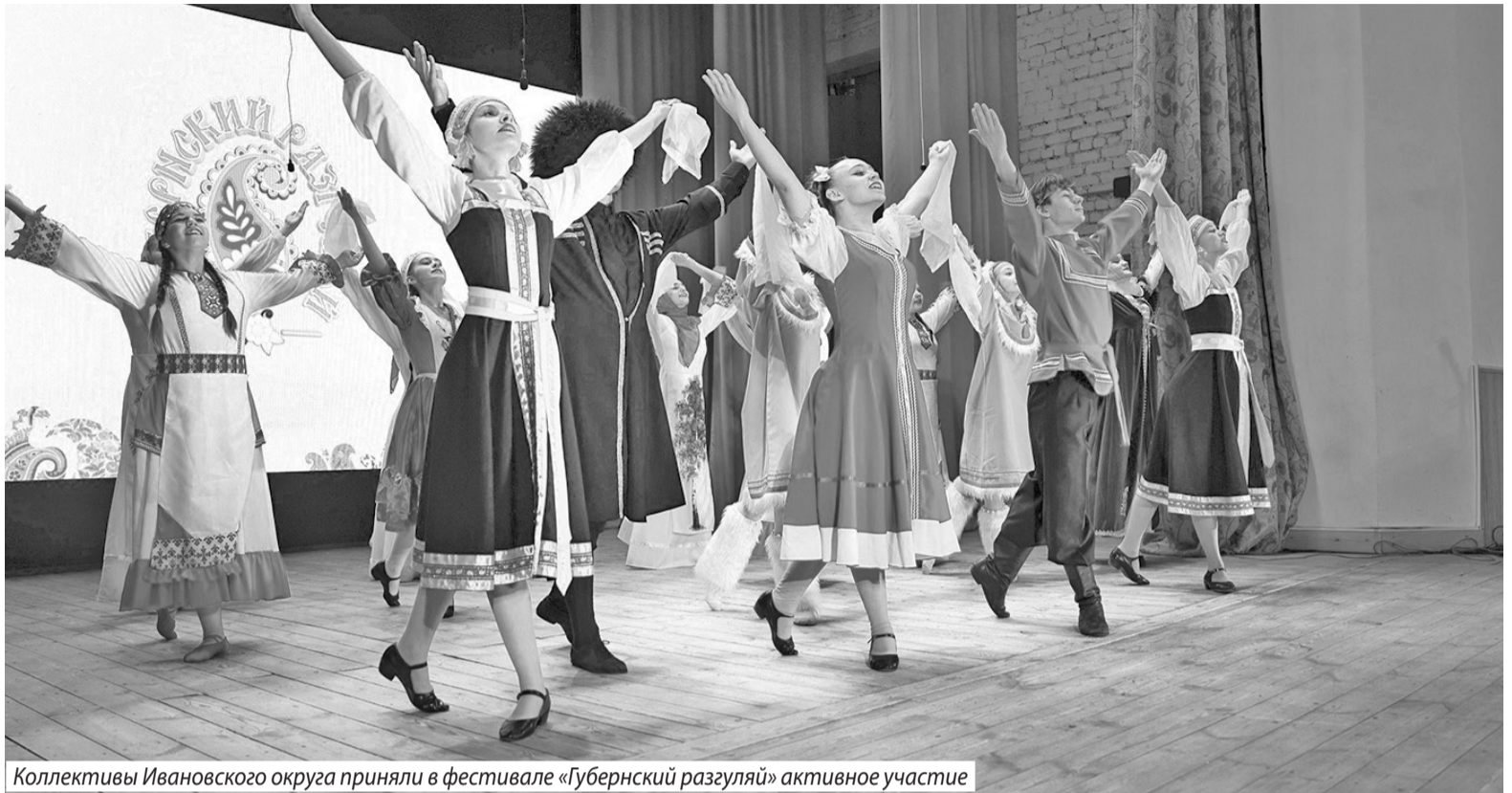
Коллективы Ивановского округа приняли в фестивале «Губернский разгуляй» активное участие

В фестивале участвовали представители разных стилей и направлений - от «классики» до уличных. Наш коллектив представил два номера. Один из них был посвящен участникам специальной военной операции. Главная мысль номера - чтобы быстрее наступил мир во всем мире. Второй наш выход - танец «Like» - мы посвятили участникам нашего коллектива, таким разным и таким