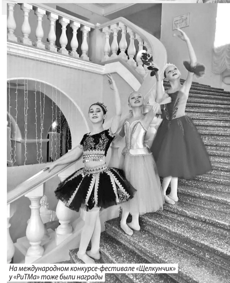
На международном конкурсе-фестивале «Щелкунчик» у «РиТМа» тоже были награды