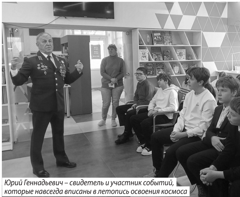
Юрий Геннадьевич - свидетель и участник событий, которые навсегда вписаны в летопись освоения космоса

Алена КОРОЛЕВА