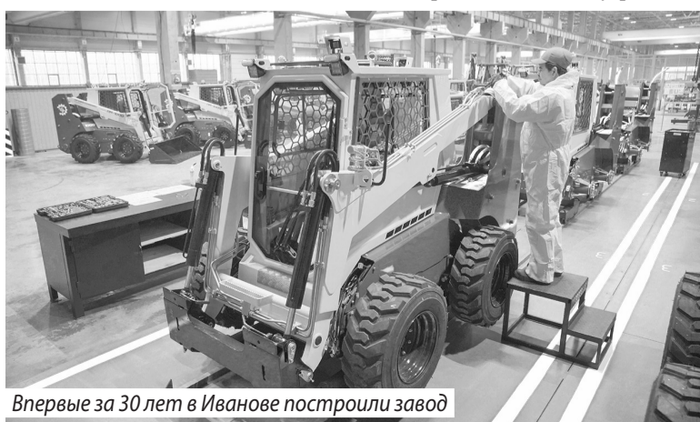
Впервые за 30 лет в Иванове построили завод

На встрече с президентом губернатор отдельно остановился на вопросах по бюджету региона.