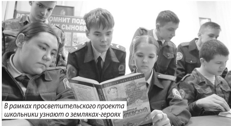
В рамках просветительского проекта школьники узнают о земляках-героях

Начало встречи было посвящено просветительскому проекту «Земля героев». «По Ивановской области видно, какая сложная история у нашей страны, как важно искать вещи, которые