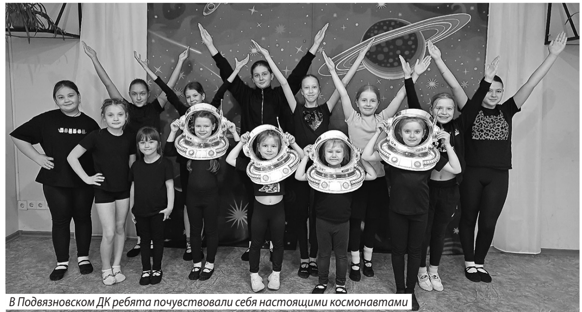
В Подвязновском ДК ребята почувствовали себя настоящими космонавтами