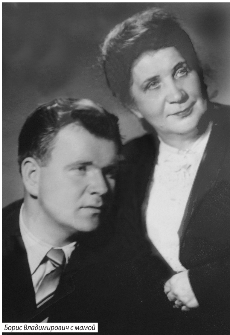
Борис Владимирович с мамой

предприятий и научных организаций, «завязанных» на космическую тематику и ракетно-ядерное вооружение. Здесь наш земляк прошел путь от начальника управления до первого заместителя министра.