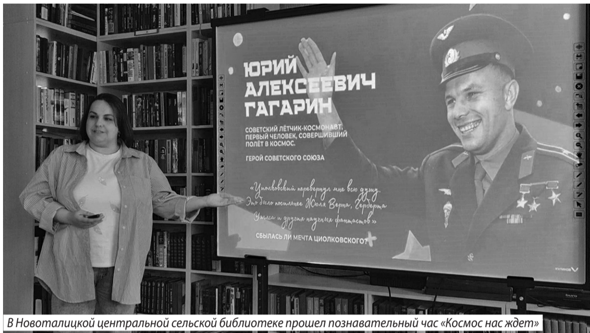
В Новоталицкой центральной сельской библиотеке прошел познавательный час «Космос нас ждет»