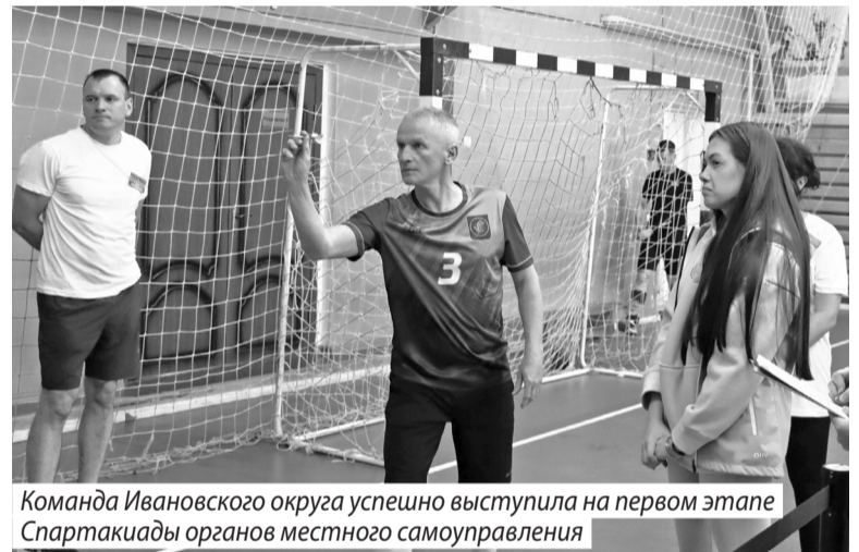
Команда Ивановского округа успешно выступила на первом этапе Спартакиады органов местного самоуправления

Народный хореографический коллектив «РиТМ» в очередной раз доказал свой высокий уровень, став участником престижного международного фестиваля «Почерк», который проходил в Ярославле. Наши талантливые танцоры представили на суд жюри