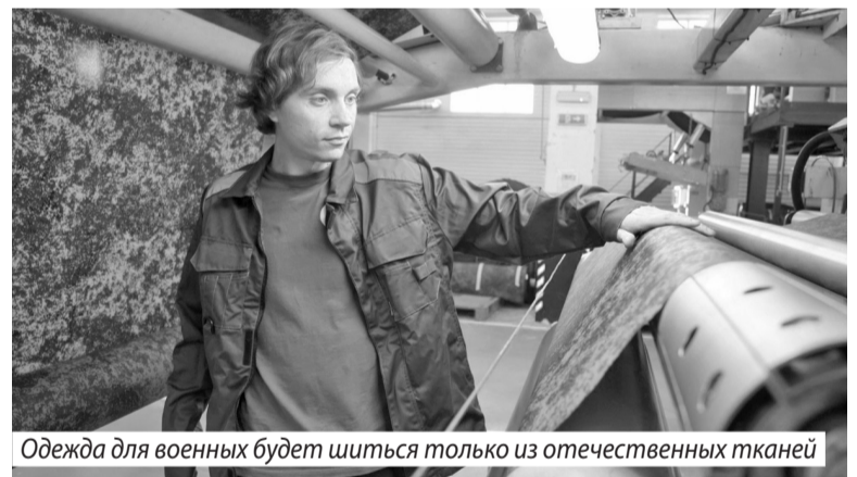
Одежда для военных будет шиться только из отечественных тканей

В их числе губернатор назвал ремонты детских садов: «У нас с этим была, честно говоря, очень сложная ситуация. Мы уже отремонтировали 200 детских садов – это почти две трети всех дошколь-