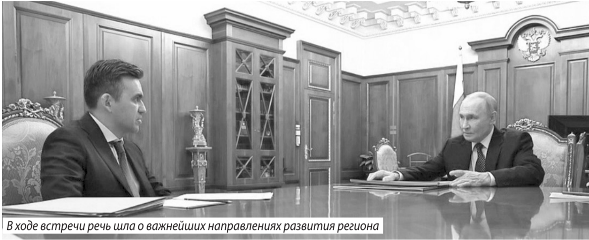
В ходе встречи речь шла о важнейших направлениях развития региона

Когда разговор зашел о промышленности, губернатор обратился к президенту: «Вы знаете, что у нас экономика традиционно опиралась на легкую промышленность. В основном это предприятия малого и среднего бизнеса. Мы в этом году продлили все налоговые льготы для предпринимателей, чтобы им легче было адаптироваться к новым налоговым условиям».