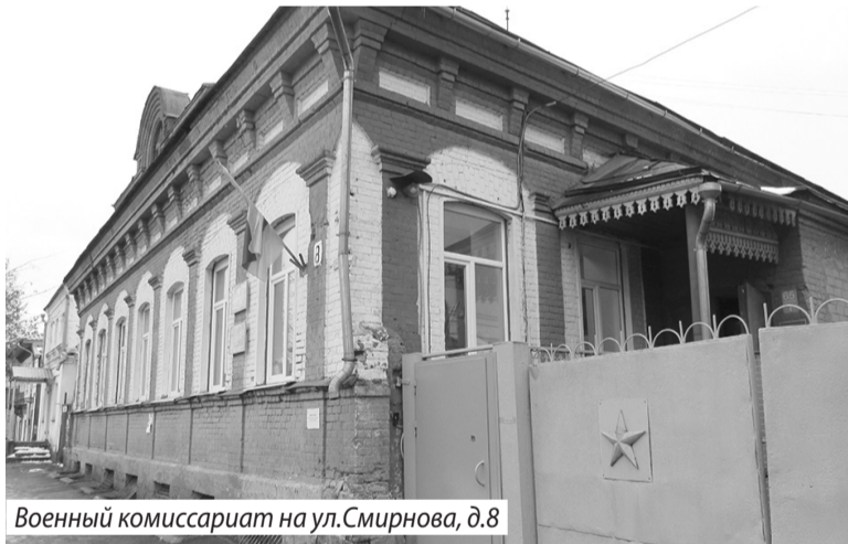
Военный комиссариат на ул.Смирнова, д.8

«Все призывники будут направлены для прохождения военной службы в пункты постоянной дис-