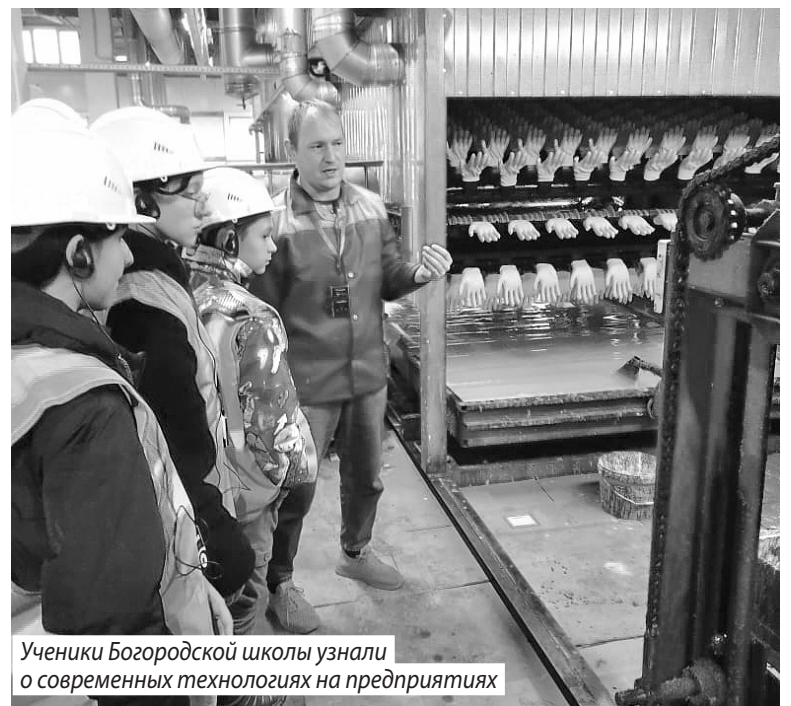
Ученики Богородской школы узнали о современных технологиях на предприятиях