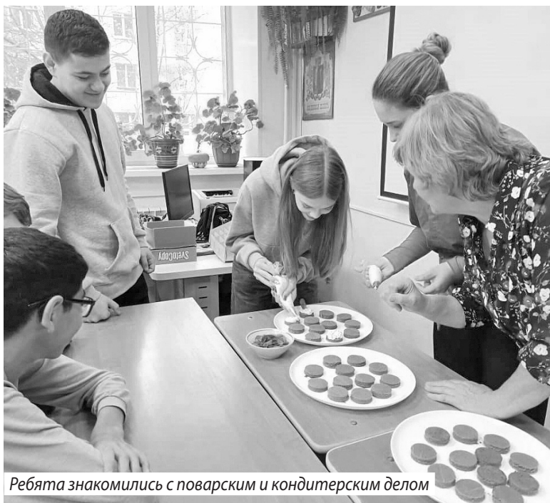
Ребята знакомились с поварским и кондитерским делом

Алена КОРОЛЕВА