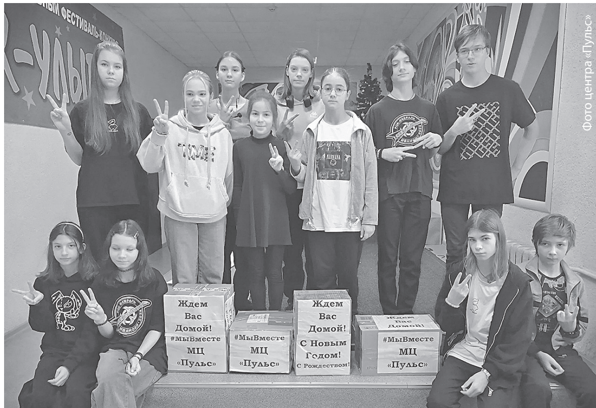
Фото центра «Пульс»

ную патриотическую жизненную позицию, за постоянную помощь солдатам, за письма, за песни, за любовь к России московский предприниматель подарил центру «Пульс» и его воспитанникам две профессиональные трубы и новогодние подарки.