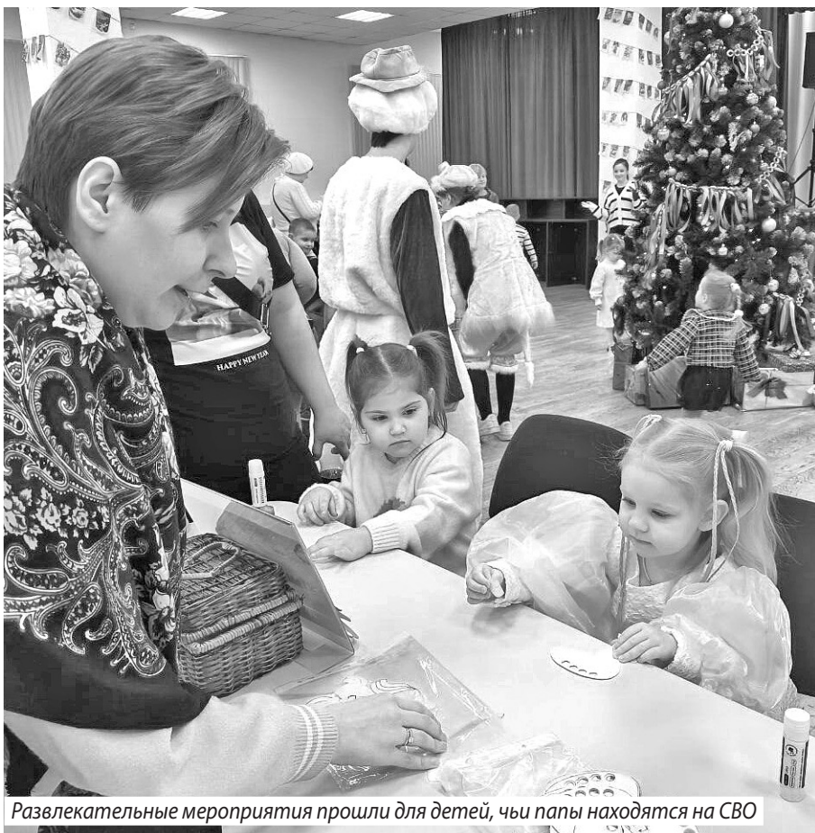
Развлекательные мероприятия прошли для детей, чьи папы находятся на СВО

Алена КОРОЛЕВА