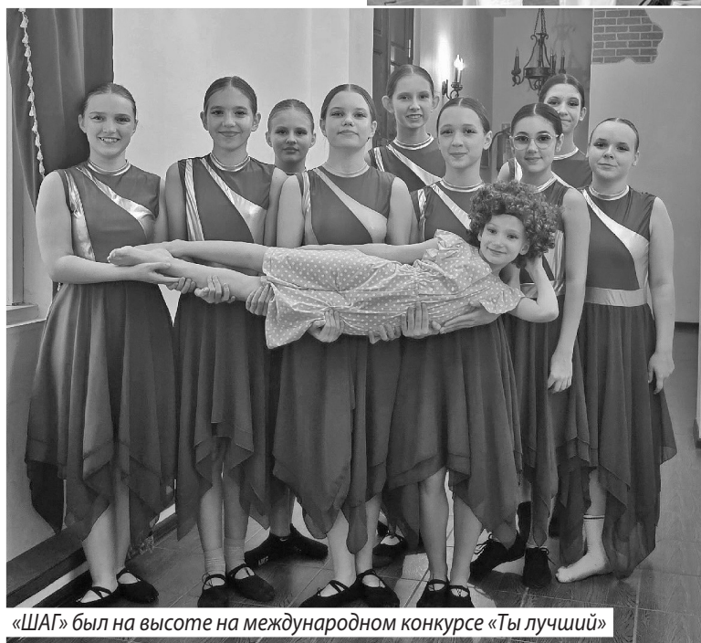
«ШАГ» был на высоте на международном конкурсе «Ты лучший»

номинации «Первый, знай и чтить историю!» («Патриотизм и историческая память») в возрастной категории 15-18 лет. По итогам девушка заняла второе место.