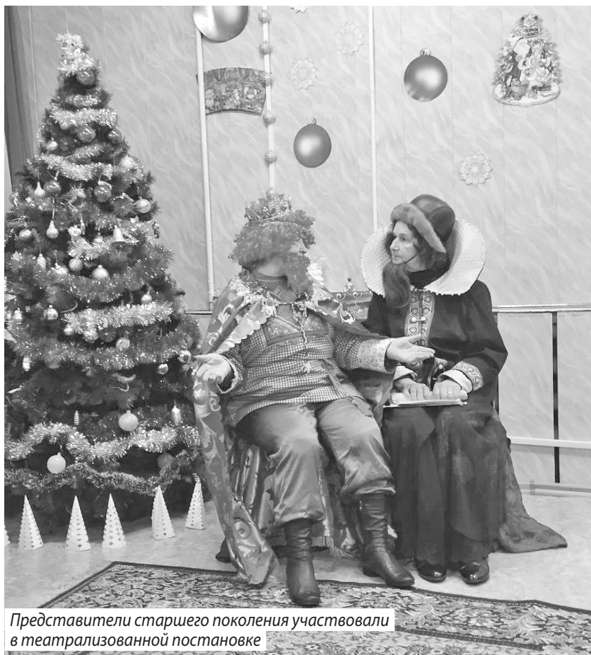
Представители старшего поколения участвовали в театрализованной постановке