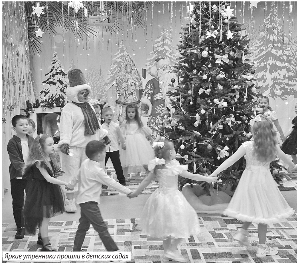
Яркие утренники прошли в детских садах