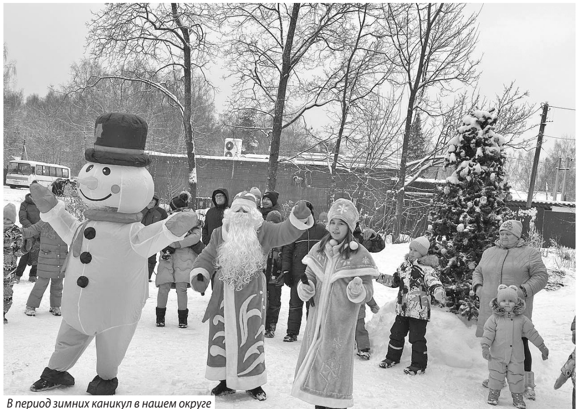
В период зимних каникул в нашем округе проводился конкурс театрализованных программ «Новогодняя карусель»

дом жители нашего муниципалитета активно участвовали в различных творческих конкурсах: «С Новым годом, любимый округ!», «Ого-го елочка», «От Деда Мороза и Снегурочки с любовью!», конкурсе пародий «Я как ты», онлайн-конкурсе «СнегурДрайв2025» и флешмобе «ТеплоеОкошко2025». Итоги скоро подведут.