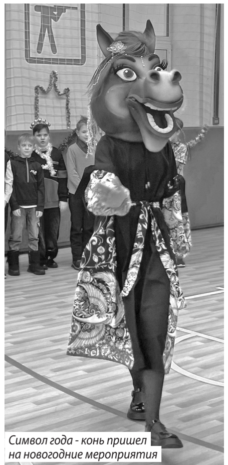
Символ года - конь пришел на новогодние мероприятия