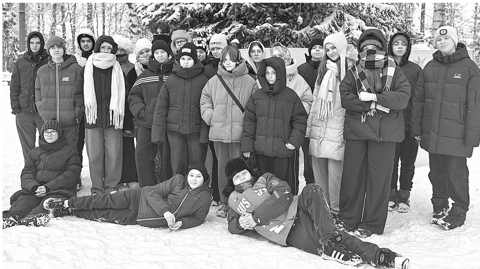
Фото участников смены

Смена в лагере «Березовая роща» продолжается, и впереди участников ждет еще много интересных и полезных мероприятий.