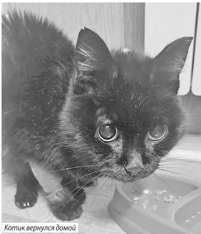
Котик вернулся домой

- Очевидно, что за долгие годы такого содержания здоровье зверя могло быть серьезно подорвано. Вариант перевозки медведя с применением наркоза мы исключили сразу. Поэтому при-