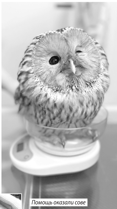
Помощь оказали сове