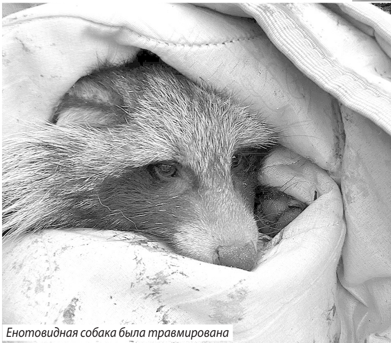
Енотовидная собака была травмирована

шлось выкупать клетку, в которой он находился, - хозяин наотрез отказался отдавать ее вместе с животным. Дополнительно мы приобрели морской контейнер, чтобы соорудить для Мурома первое убежище. В операции по спасению было задействовано большое количество спецтехники. На первом этапе мы приварили его старую клетку к специально приобретенному морскому контейнеру, организовав для медведя достаточно большое помещение. У нас не было моральных сил оставить животное в старой клетке в ожидании постройки вольера. Смотреть на его страдания было невозможно, - вспоминают волонтеры.