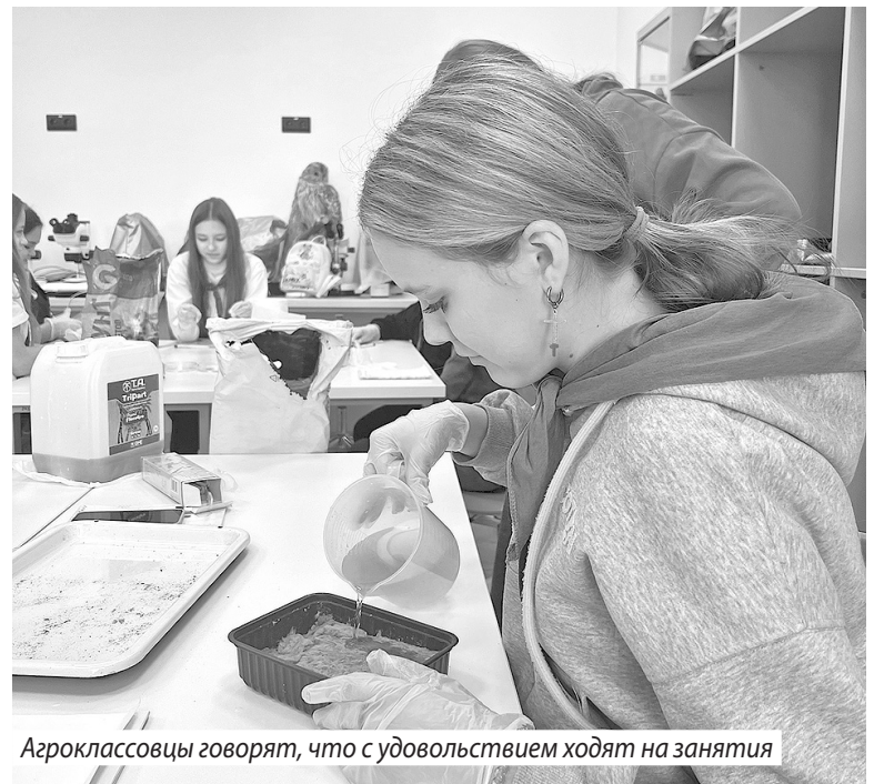
Агроклассовцы говорят, что с удовольствием ходят на занятия

Теоретические знания ребята вместе с опытными руководителями из центра «Солярис» и Верхневолжского агробиотехнологического университета проверяли на практике. Они учились самостоятельно готовить питательные растворы, являющиеся основой для гидропонного метода выращивания растений, создавать условия для гидропоники, различать зерновые и бобовые культуры, определять, какие из них пригодны для посева. Итогом интенсива стали