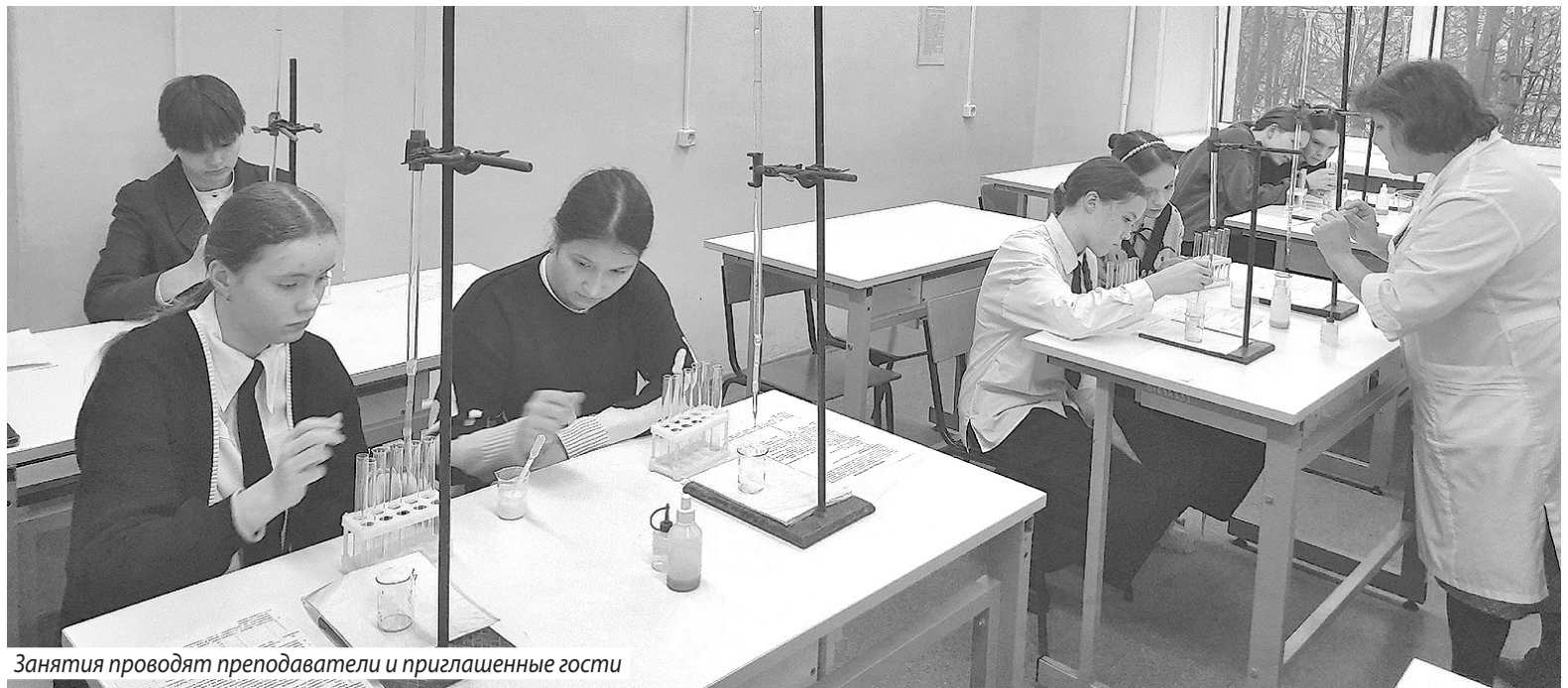
Занятия проводят преподаватели и приглашенные гости

Всего в Ивановской области в этом учебном году работают 37 агроклассов в 25 школах. В них обучаются свыше 500 ребят. «Школьники проходят теоретический курс по растениеводству, знакомятся с технологиями выращивания и ухода за основными сельхозкультурами. Практические занятия проходят на базе ведущих сельхозпредприятий и фермерских хозяйств Ивановской области», - отметили в региональном департаменте образования и науки.