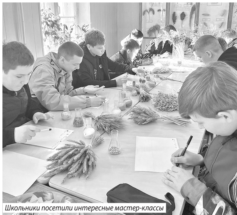
Школьники посетили интересные мастер-классы

приятиях. Например, ученики написала агродиктант. А еще они отправились в центр «Солярис» на интенсив «Агрошкола».