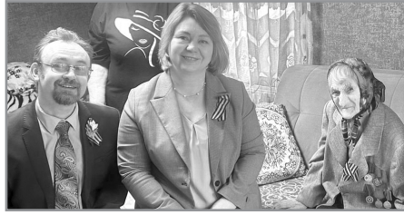
В БАЛАХОНКАХ ЖИТЕЛЬНИЦА ОТМЕТИЛА 100-ЛЕТНИЙ ЮБИЛЕЙ