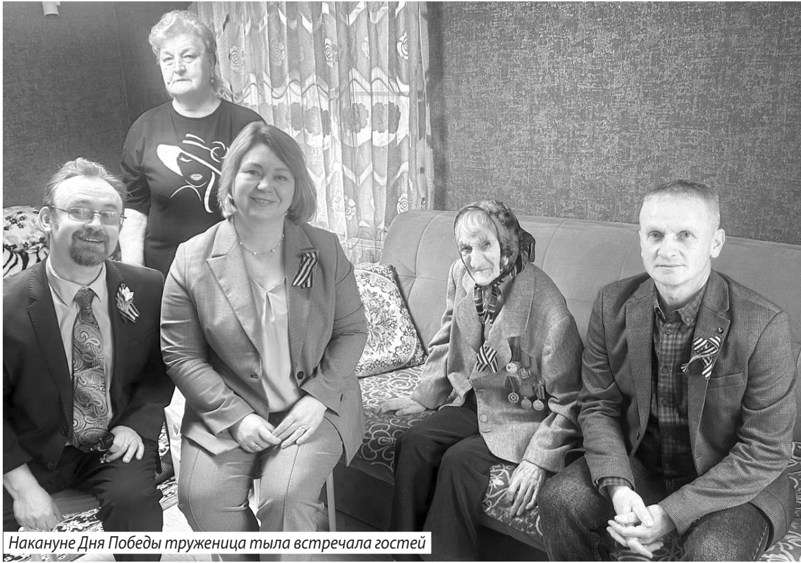
Накануне Дня Победы труженица тыла встречала гостей

– Девушки, в том числе и моя мама, не только много работали, учились, но и весело от-