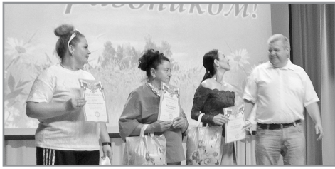
В ЧЕРНОРЕЧЕНСКОМ ОТПРАЗДНОВАЛИ ДЕНЬ СЕЛА