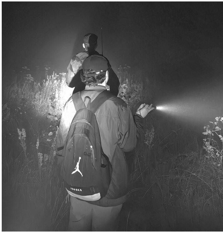
Фото отряда «ЛизаАлерт» носит иллюстративный характер