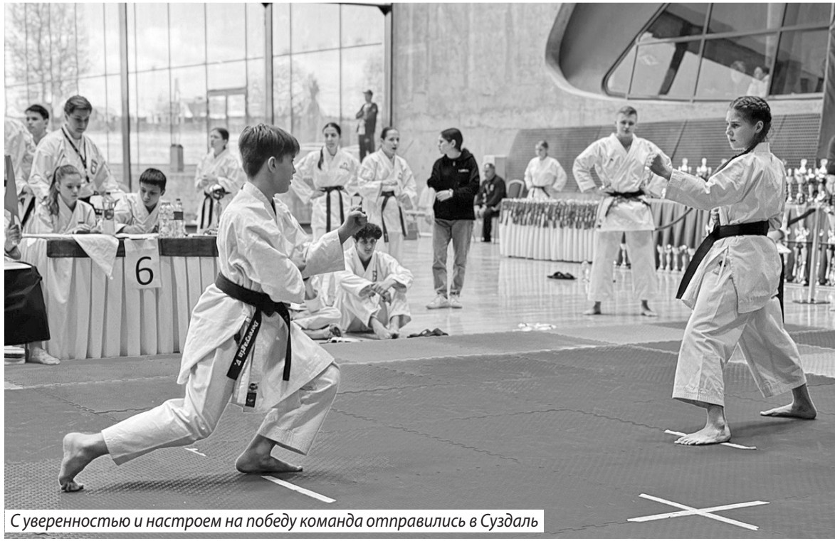
С уверенностью и настроем на победу команда отправилась в Суздаль