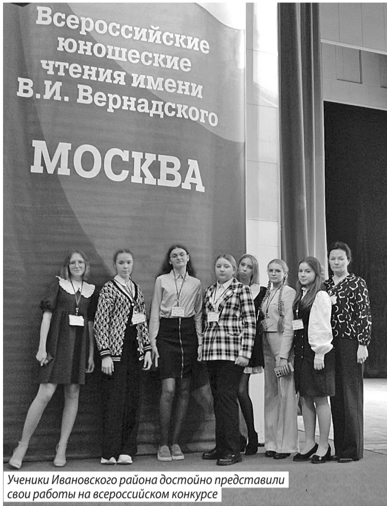
Ученики Ивановского района достойно представили свои работы на всероссийском конкурсе

В ходе программы конкурса юные исследователи и их наставники смогли не только представить свои работы, но и познакомиться с Москвой: в программе были экскурсии в музей-квартиру