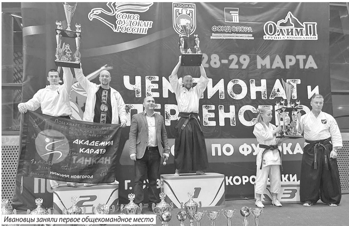
Ивановцы заняли первое общекомандное место