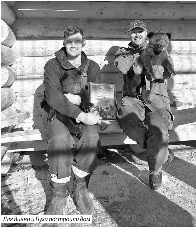
Для Винни и Пуха построили дом

Уже год волонтеры занимаются лечением, реабилитацией, подготовкой к выпуску и выпуском в естественную среду обитания диких братьев меньших, если это представляется возможным.