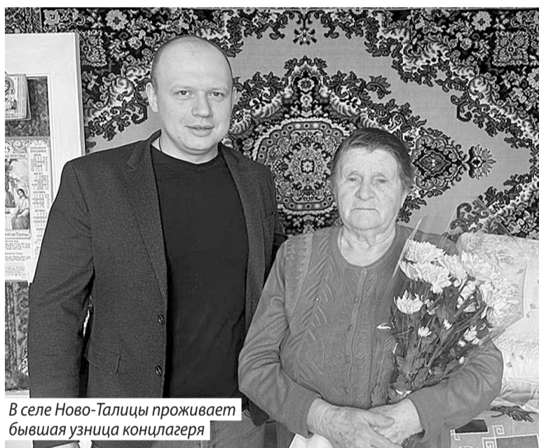
В селе Ново-Талицы проживает бывшая узница концлагеря

Также в Ивановском районе состоялись памятные митинги с возложением цветов. У мемориалов прошли часы памяти. Так, в Бунькове работники библиотеки и Дома культуры провели для школьников мероприятие «Это нельзя забывать!». Ребятам напомнили, что наш долг - сделать все возможное, чтобы подобные преступления никогда не повторились. Завершилось мероприятие минутой молчания в память о жертвах фашизма.