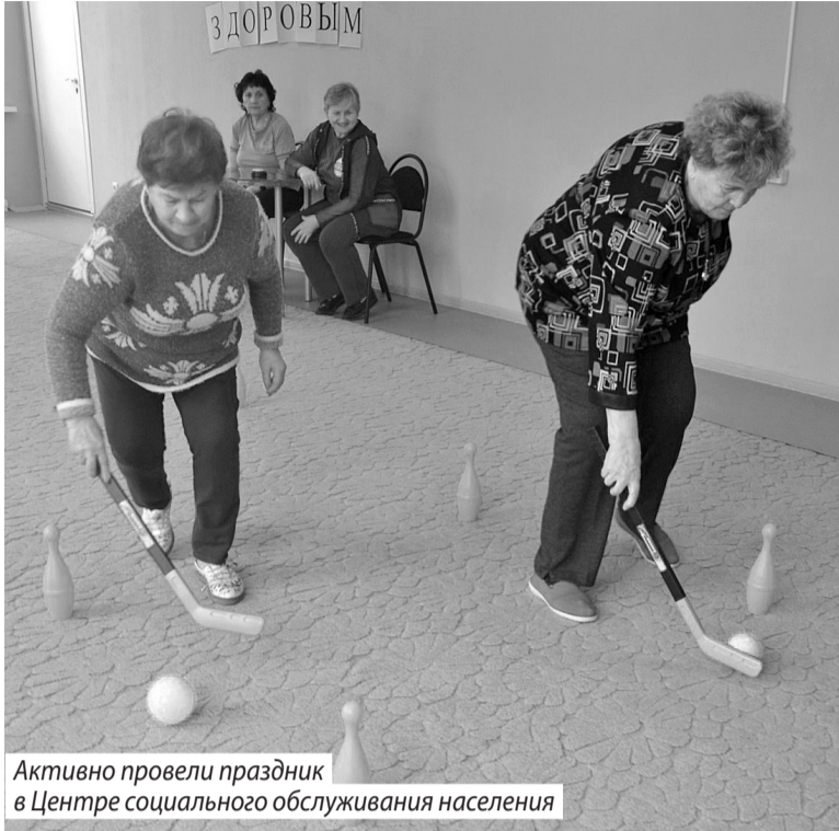
Активно провели праздник в Центре социального обслуживания населения

Традиционно ко Всемирному дню здоровья в нашем муниципалитете прошел фитнес-фестиваль «Движение - жизнь!». Он состоялся на базе молодежно-спортив-