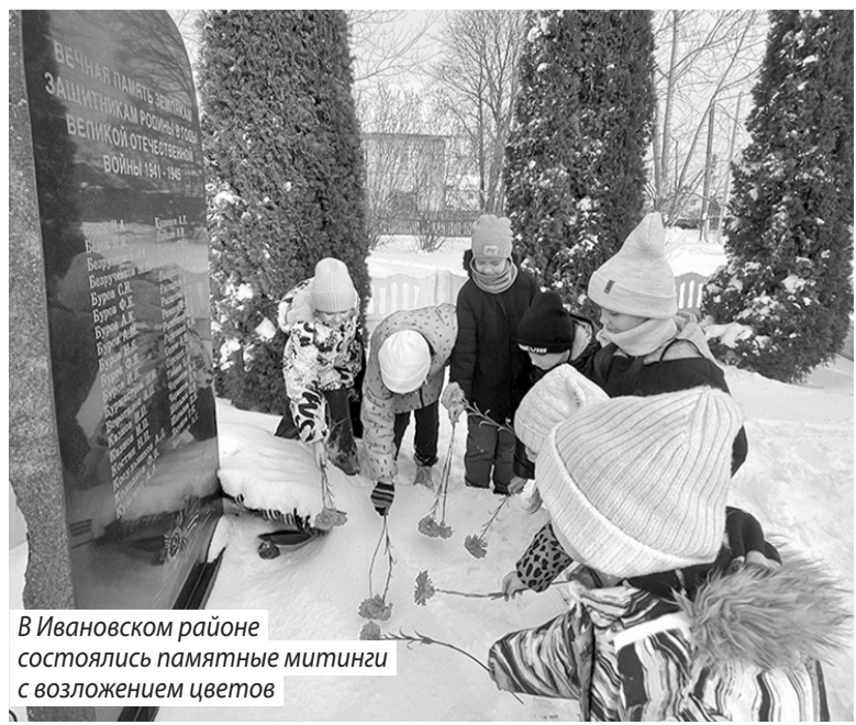
В Ивановском районе состоялись памятные митинги с возложением цветов

Алена КОРОЛЕВА