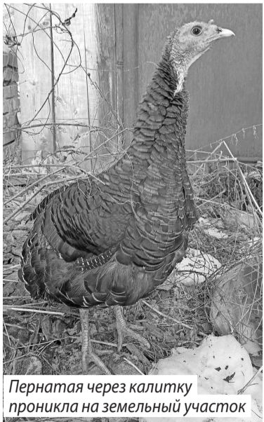
Пернатая через калитку проникла на земельный участок

Специалисты «Легенды» забрали утку и отвезли в клинику к врачу-орнитологу. После пройденного курса лечения волонтеры