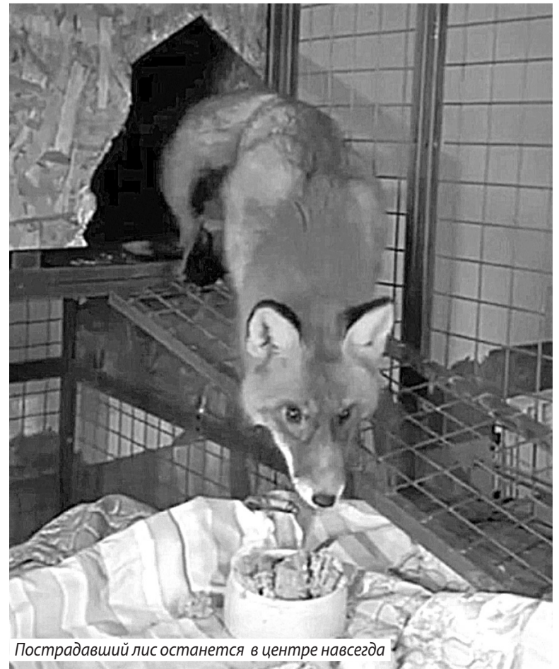
Пострадавший лис останется в центре навсегда