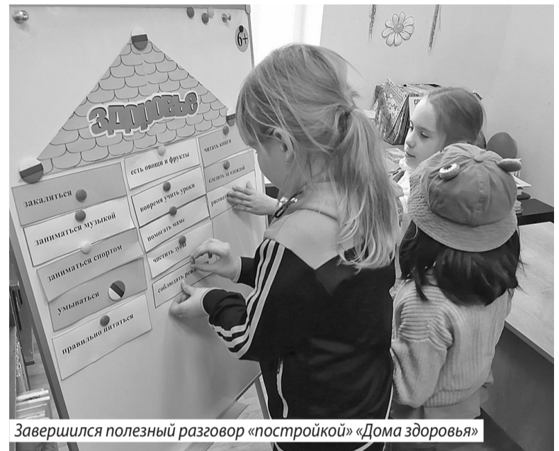
Завершился полезный разговор «постройкой» «Дома здоровья»

Путешествуя по «Стране полезных и вредных привычек», дети побывали на станциях «Польза-вред», «Красный или зеленый», «Планеты», «Угадай-ка». Завершился полезный разговор «постройкой» «Дома здоровья»,