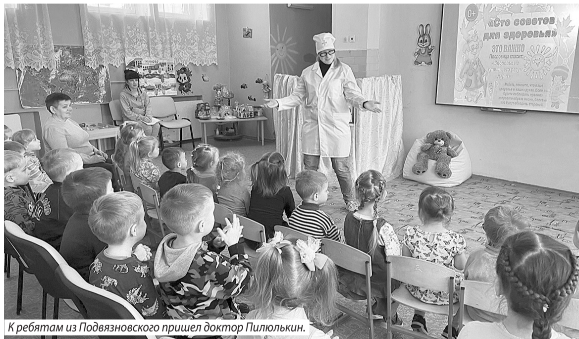
К ребятам из Подвязновского пришел доктор Пилулькин.

ного центра «Олимп». В этом году мероприятие было посвящено Году защитника Отечества и 80-летию Победы в Великой Отечественной войне.