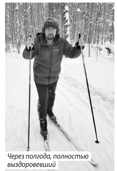
Через полгода, полностью выздоровевший

В первый же день после выписки ушел дышать в любимый парк