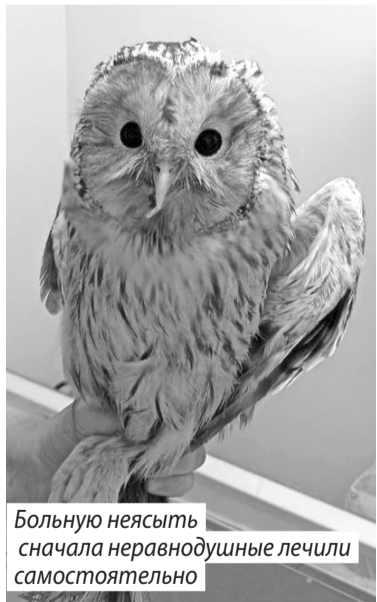
Большую неясыть сначала неравнодушные лечили самостоятельно

Через некоторое время волонтеры смогли осуществить задуманное. На территории разместили первые вольеры для лисиц, енотовидных собак и маленького дикого кабанчика, спасенного от охотников. Для сов, осоедов, диких раненых уток и большого количества травмированных городских птиц первично