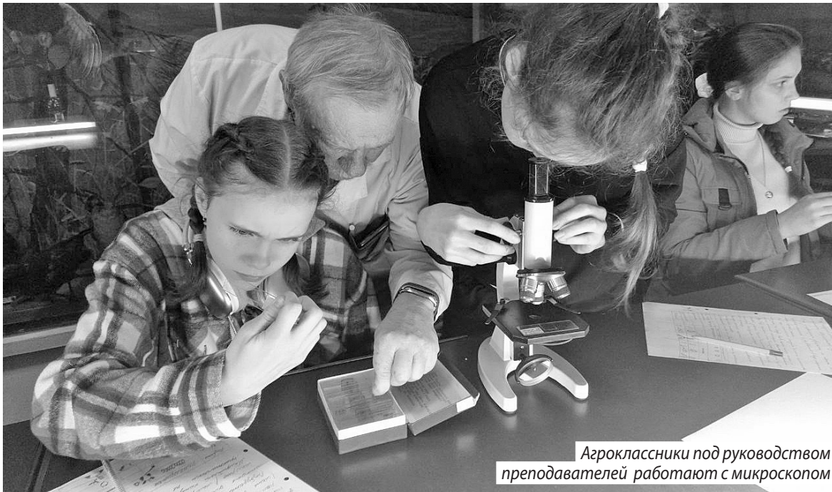
Агроклассники под руководством преподавателей работают с микроскопом

В первый день осенних каникул ребята совершили экскурсию в комплекс «ПроАгро», который расположен в поселке Ильинское-