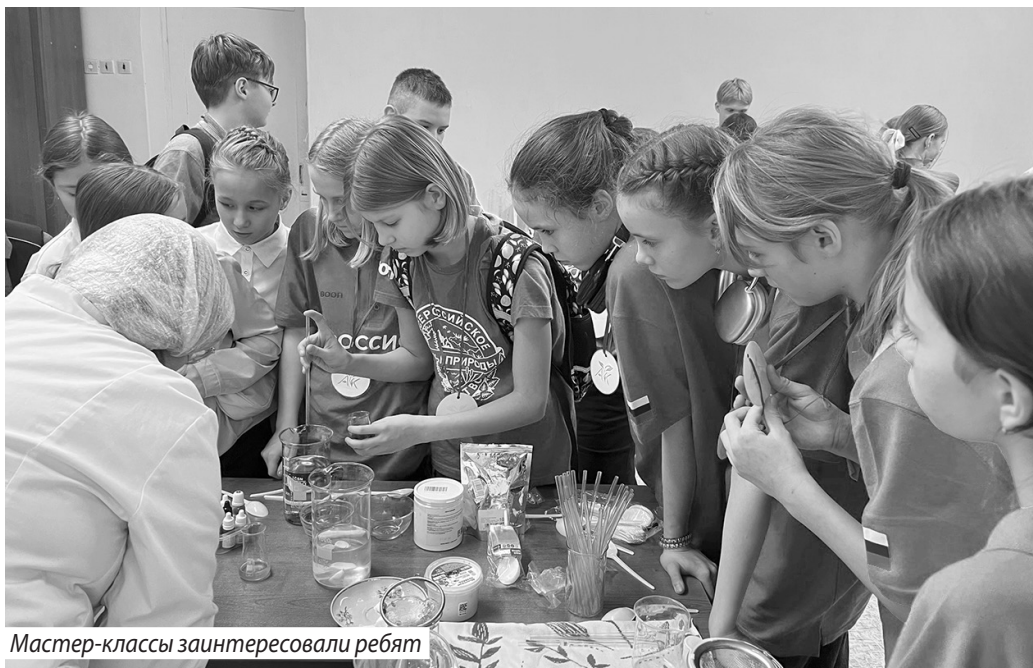
Мастер-классы заинтересовали ребят

Алена КОРОЛЕВА