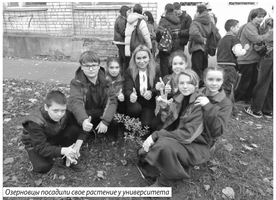
Озерновцы посадили свое растение у университета