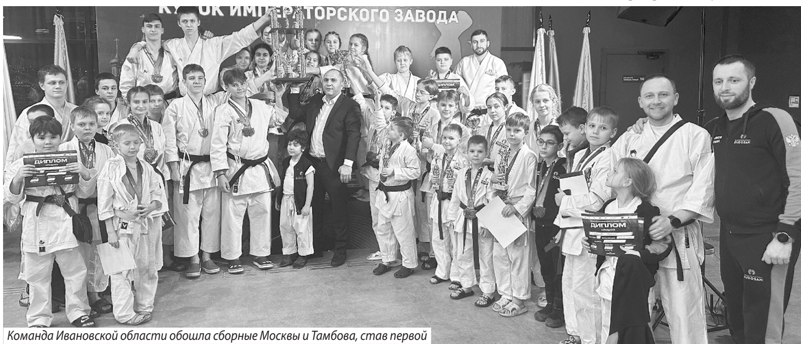
Команда Ивановской области обошла сборные Москвы и Тамбова, став первой