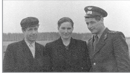
ВОЙНА В ИСТОРИИ МОЕЙ СЕМЬИ