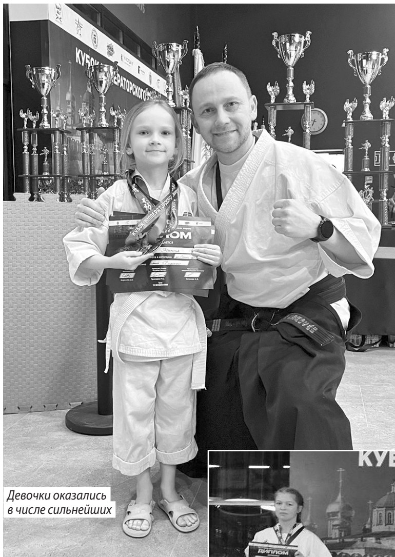
Девочки оказались в числе сильнейших

Еще один воспитанник объединения «БудоСан ММА» Цен-