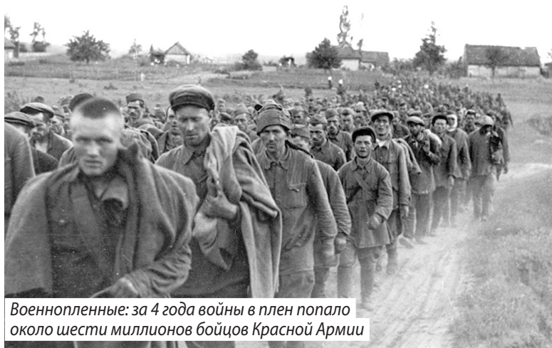
Военнопленные: за 4 года войны в плен попало около шести миллионов бойцов Красной Армии