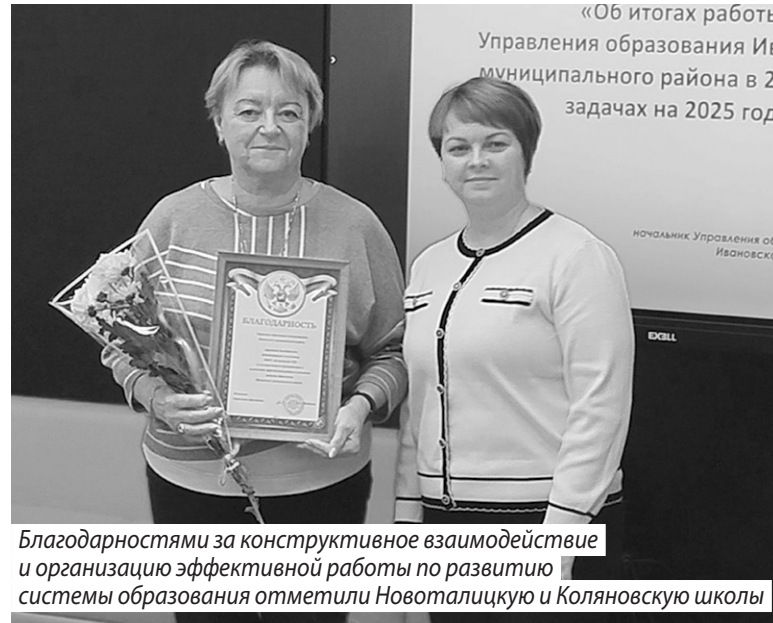
Благодарностями за конструктивное взаимодействие и организацию эффективной работы по развитию системы образования отметили Новоталицкую и Коляновскую школы

Помимо этого, в Подвязновской школе были проведены работы по капитальному ремонту пищеблока, выполнен ремонт