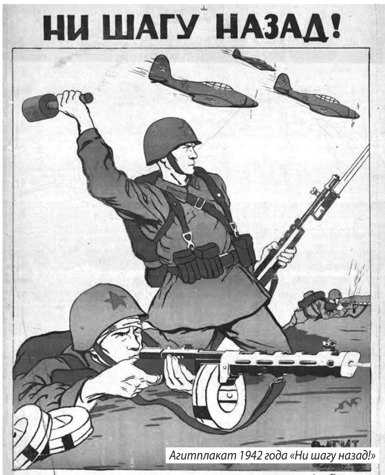
Агитплакат 1942 года «Ни шагу назад!»

Нашла данные о 203 стрелковой дивизии, где в составе 610 стрелкового полка воевал крас-