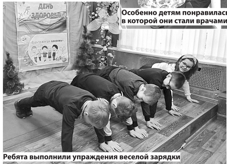
Ребята выполнили упражнения веселой зарядки