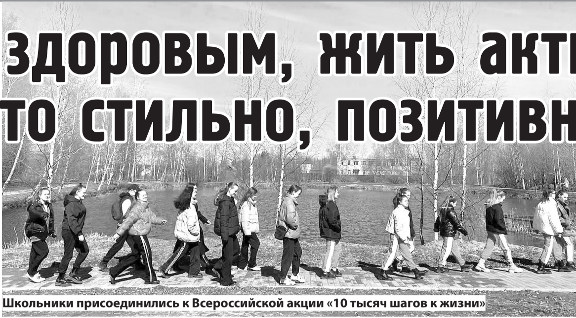
Школьники присоединились к Всероссийской акции «10 тысяч шагов к жизни»

Выступления участников оценивала судейская коллегия, в ко-