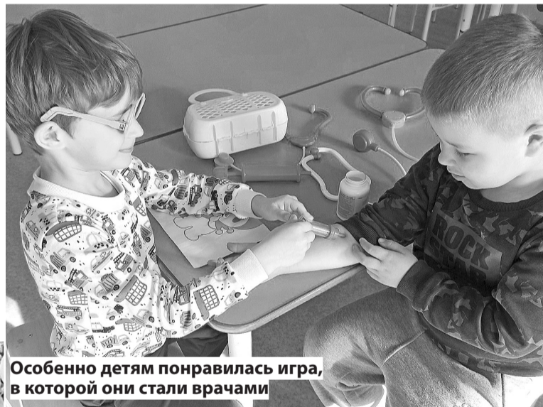
Особенно детям понравилась игра, в которой они стали врачами