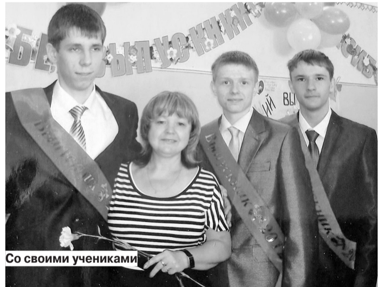
Со своими учениками