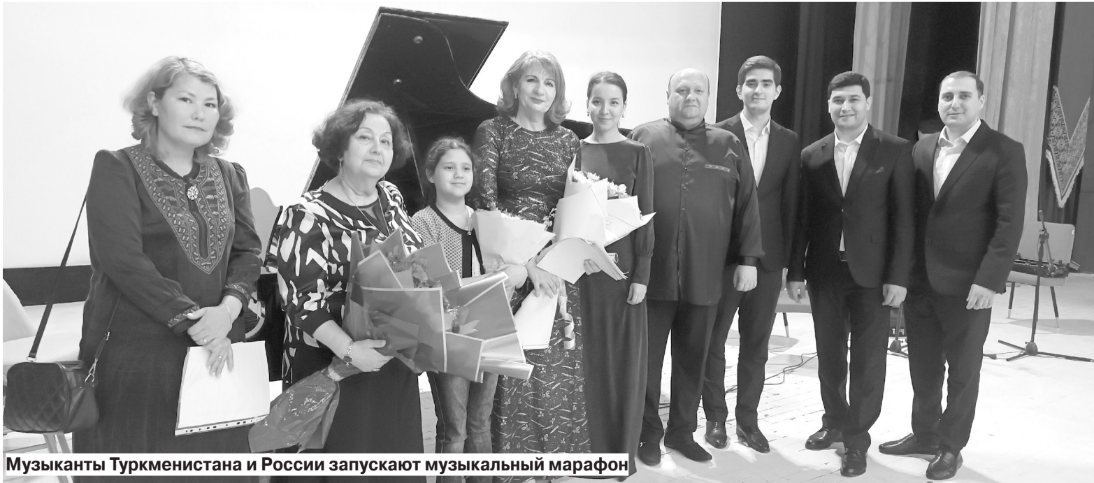
Музыканты Туркменистана и России запускают музыкальный марафон