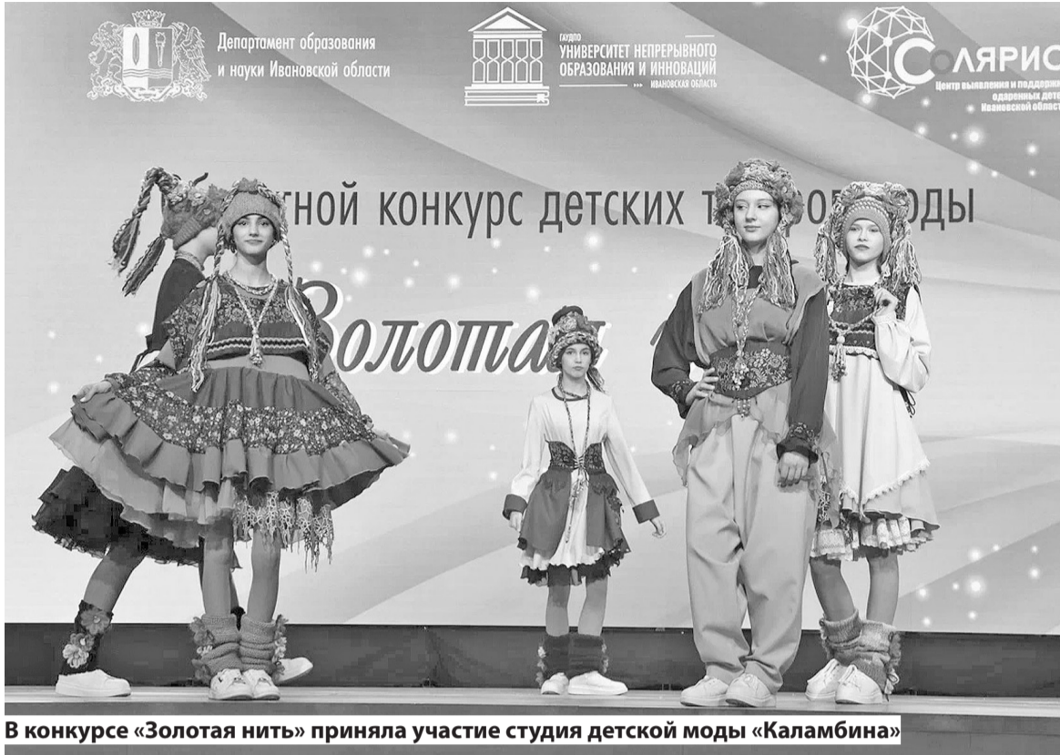
В конкурсе «Золотая нить» приняла участие студия детской моды «Каламбина»

Многие ребята уже принимали участие в хореографических конкурсах, но для кого-то это был первый сценический дебют на большой сцене. Добавлю, что поездка на какой-либо фестиваль - это целое событие не только для девочек, но и для их семей, поэтому наш коллектив всегда приезжает с большой группой поддержки в виде пап и мам.