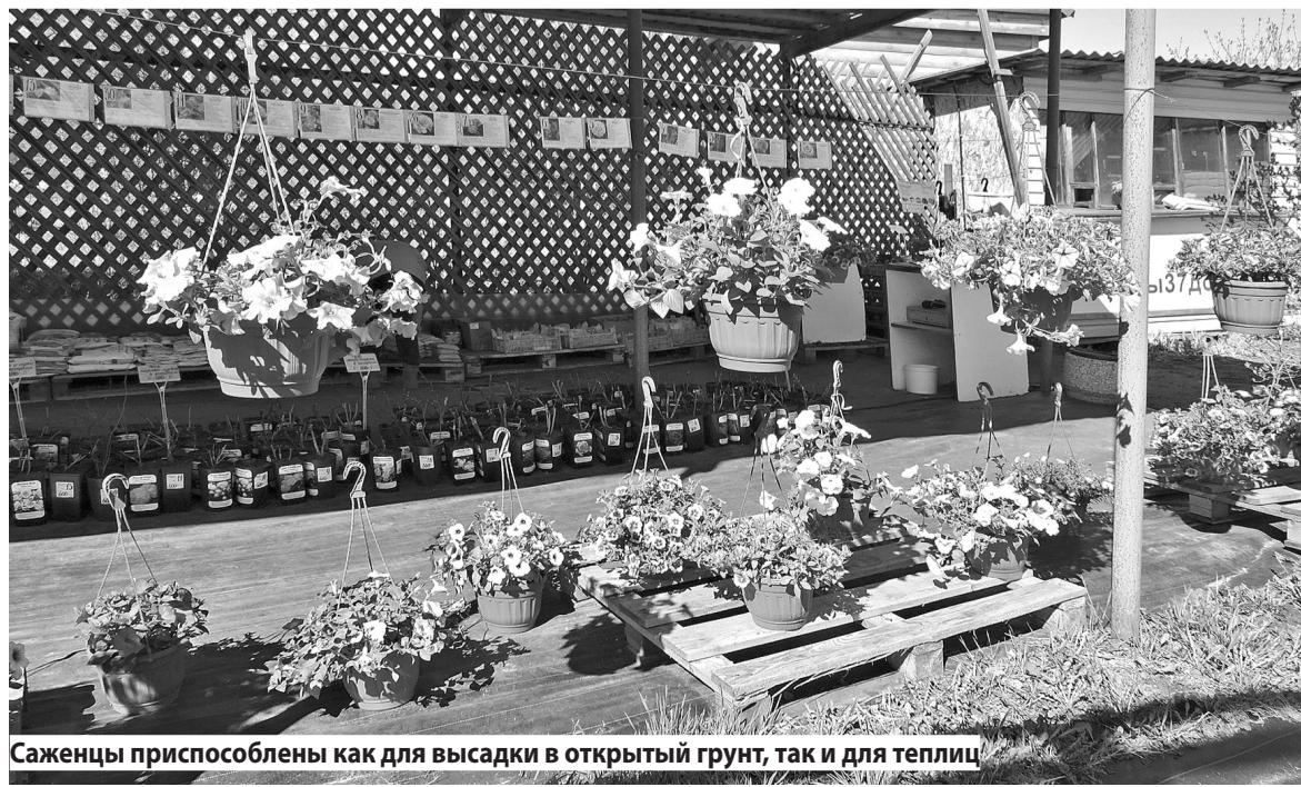
Саженцы приспособлены как для высадки в открытый грунт, так и для теплиц