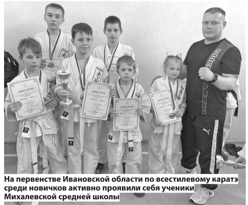
На первенстве Ивановской области по всестилевому каратэ среди новичков активно проявили себя ученики Михалевской средней школы

Удачным был для Ивановского района зональный этап Спартакиады органов местного са-