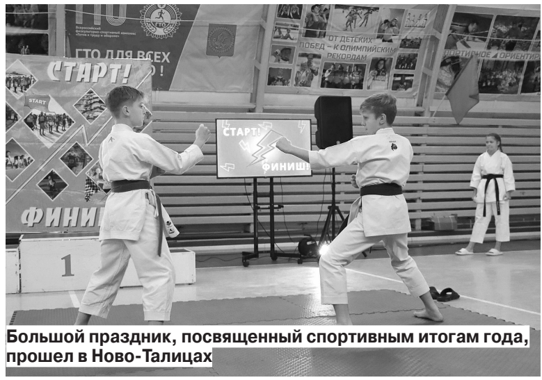
Большой праздник, посвященный спортивным итогам года, прошел в Ново-Талицах