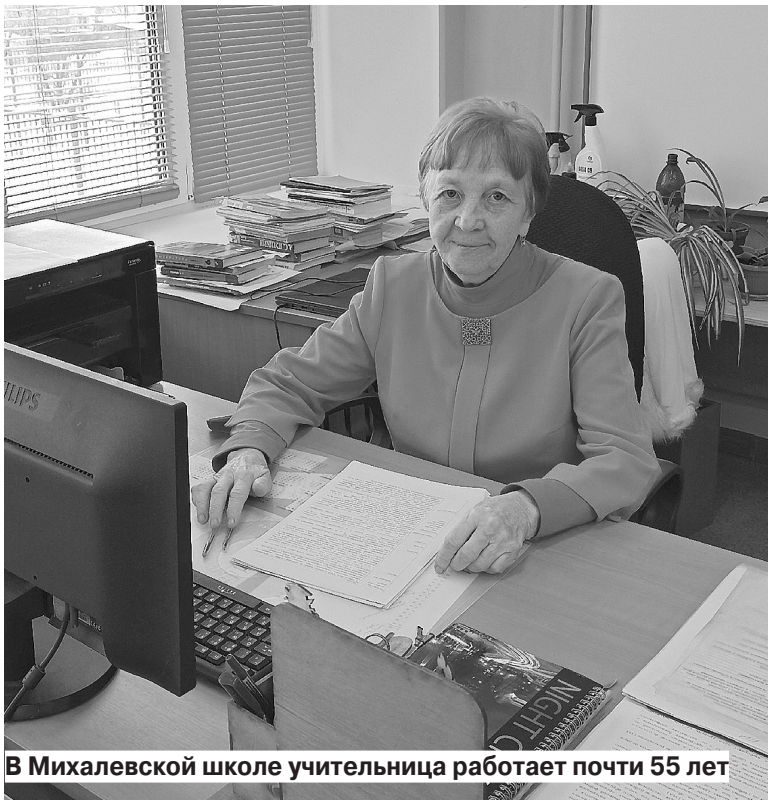
В Михалевской школе учительница работает почти 55 лет