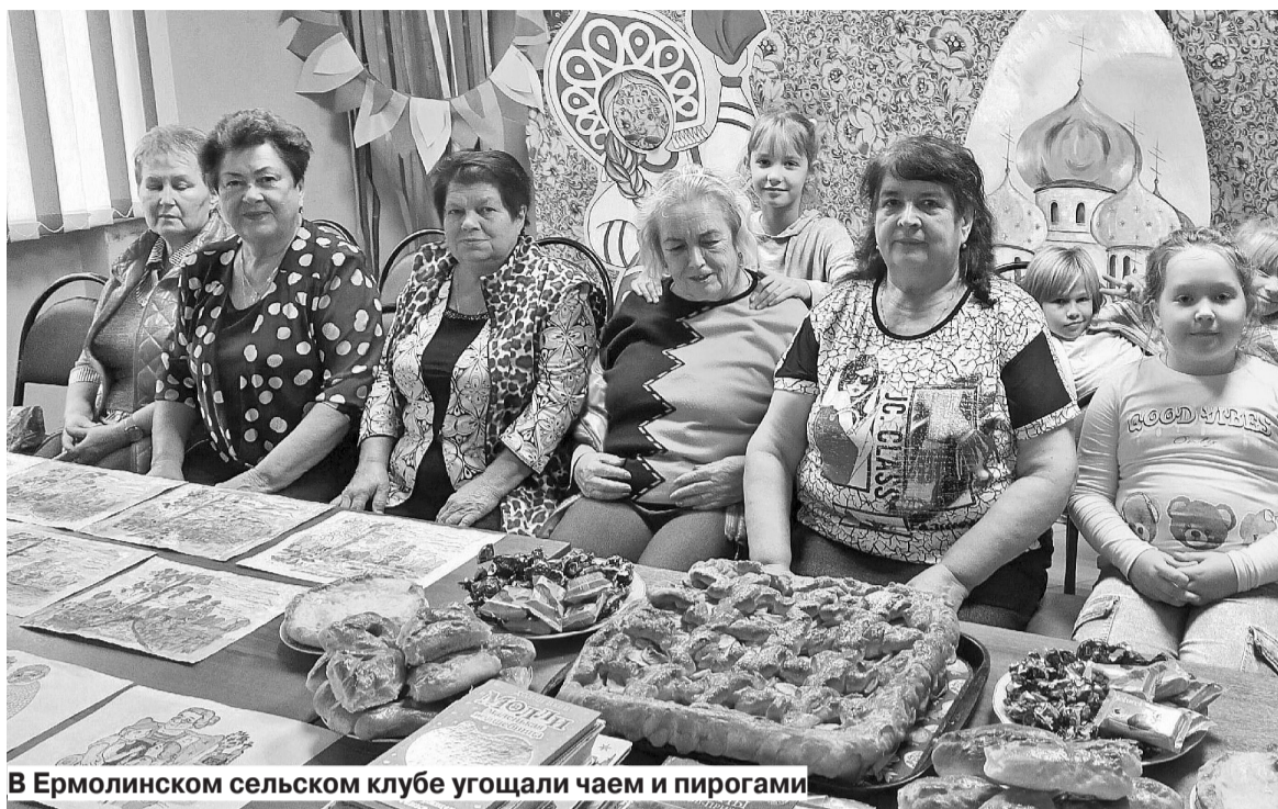
В Ермолинском сельском клубе угощали чаем и пирогами

В рамках национального проекта «Демография» регионального проекта «Старшее поколение» в отделениях социального обслуживания на дому граждан пожилого возраста и инвалидов для представителей старшего поколения состоялось инте-