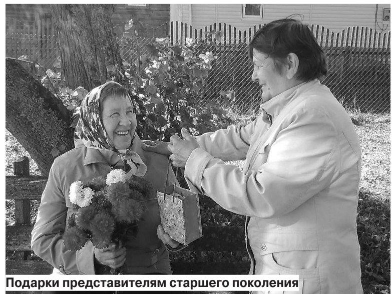
Подарки представителям старшего поколения