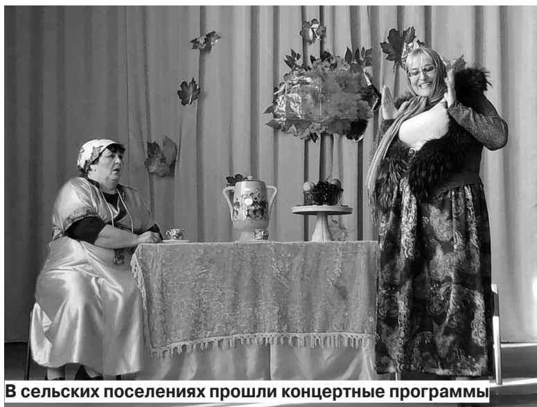
В сельских поселениях прошли концертные программы