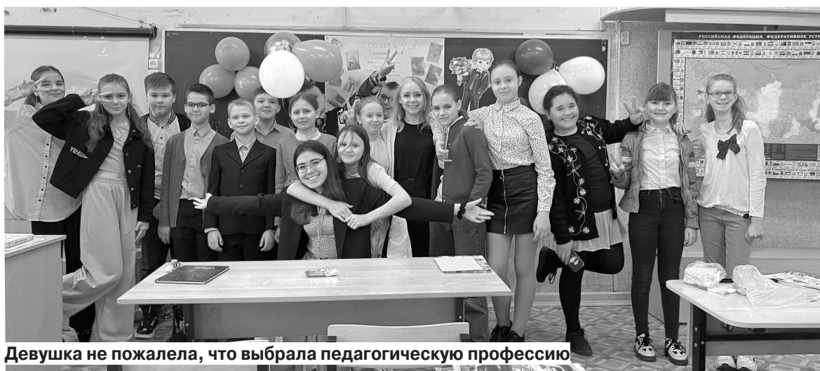
Девушка не пожалела, что выбрала педагогическую профессию