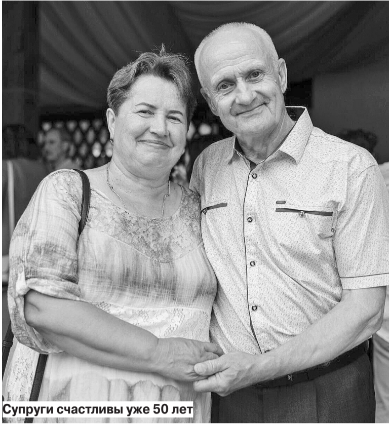
Супруги счастливы уже 50 лет

- Я родилась в поселке Борок, потом переехали в Никольское. Нас в семье было пятеро детей. Старшая сестра родилась незадолго до начала Великой Отечественной войны, остальные братья и сестры, в том числе и я, уже после возвращения отца с фронта. Наш поселок находился в лесной глуши. До школы - три километра. Рядом - река, которая весной разливалась по всей