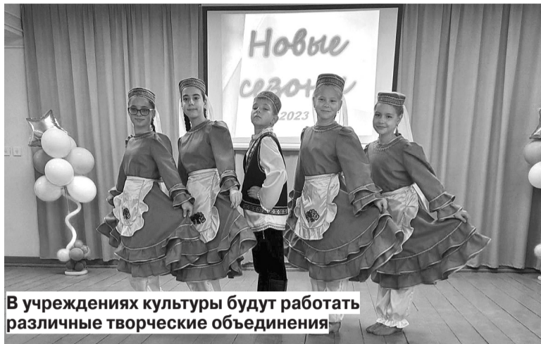
В учреждениях культуры будут работать различные творческие объединения

Различные творческие объединения будут действовать и в селе Подвязновский. В их числе - вокальный коллектив художественной самодеятельности для взрослых «Надежда», кружок по прикладному творчеству «Фантазия» и швейный кружок «Рукодельница» под руководством Надежды Венк, театральные кружок для детей «Творческий