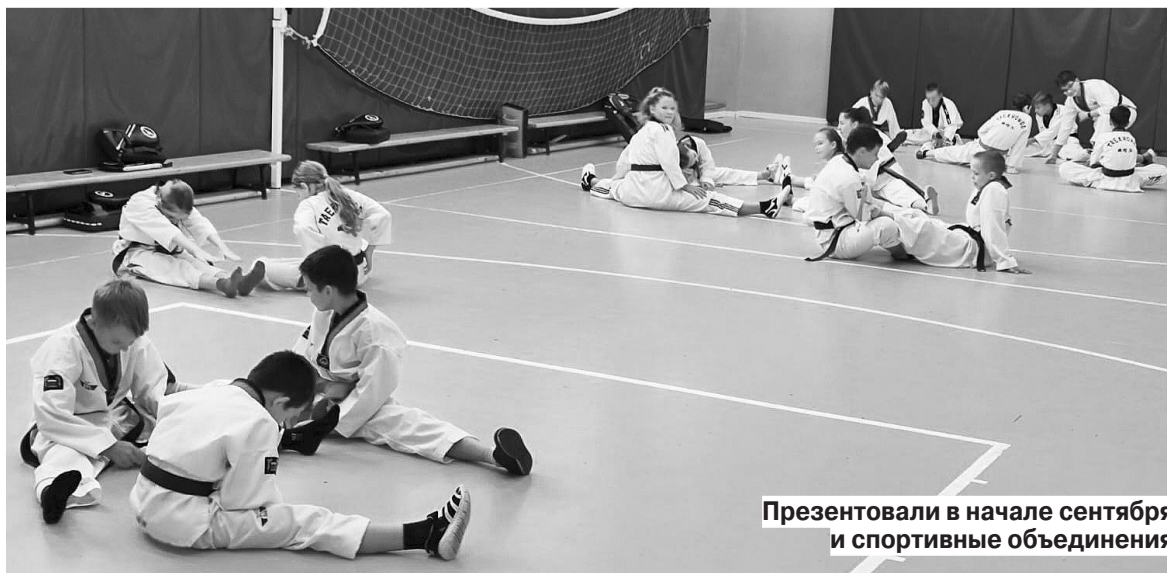
Презентовали в начале сентября и спортивные объединения