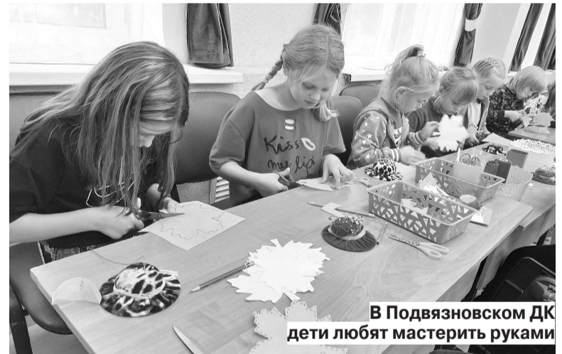
В Подвязновском ДК дети любят мастерить руками

Праздник «Новых сезонов» провели и работники библиотек. Например, в михалевской каждый желающий получил информацию о предстоящих мероприятиях для детей и взрослых, а также смог показать свои знания в области краеведения, участвуя в фотовикторине «Край родной Ивановский». «Новый