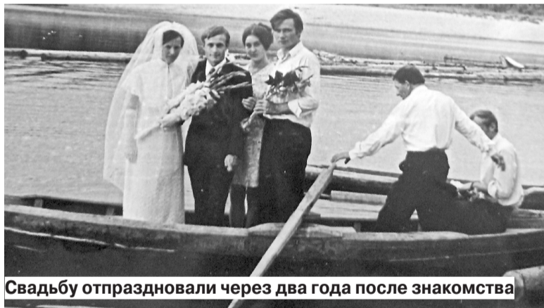
Свадьбу отпраздновали через два года после знакомства