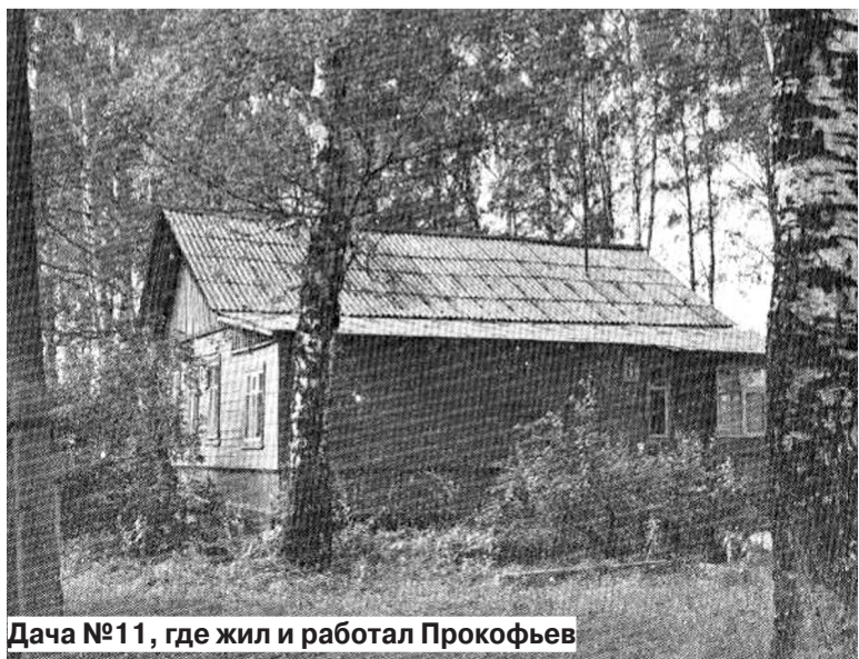
Дача №11, где жил и работал Прокофьев