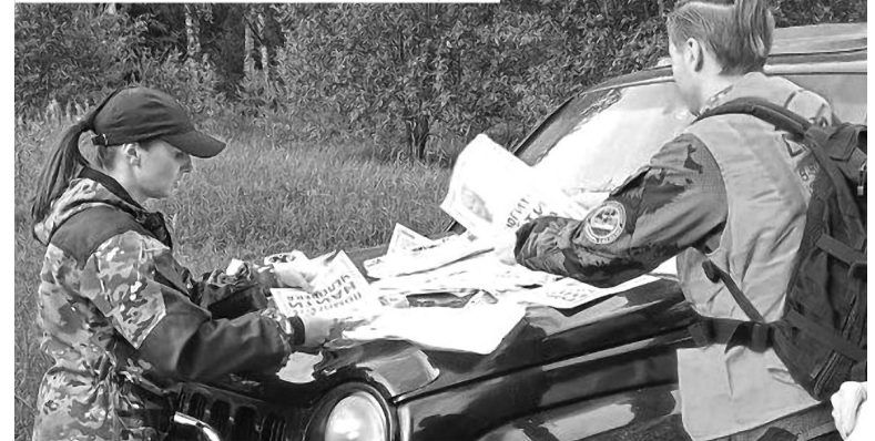
Волонтеры практически каждый день выезжают на поиски грибников — не только в выходные, но и в будни