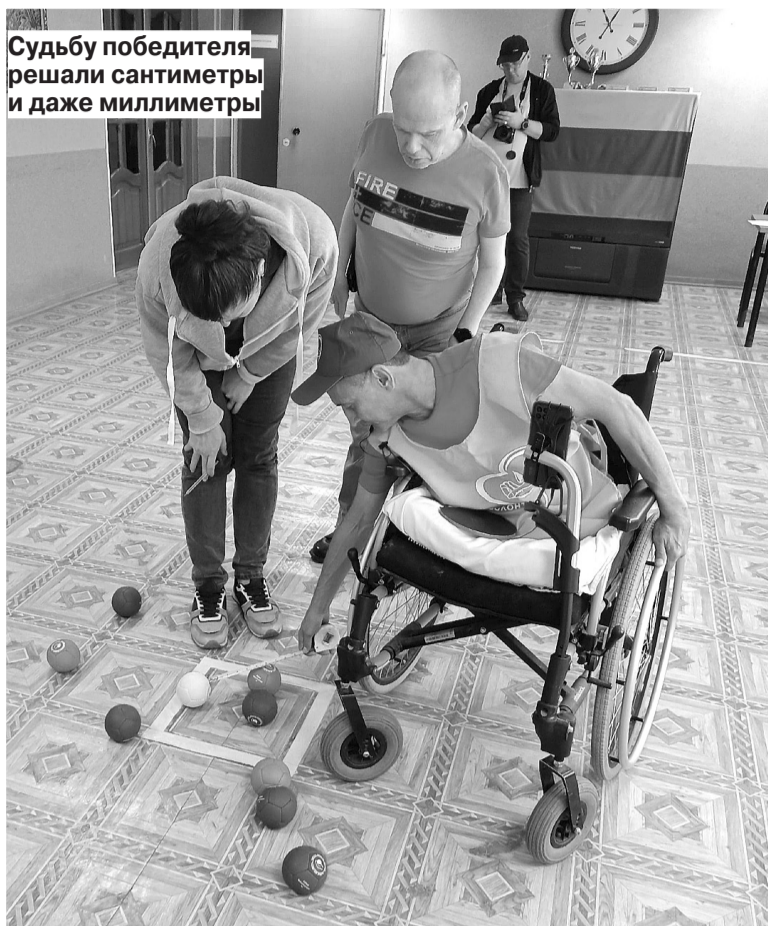
Судьбу победителя решали сантиметры и даже миллиметры