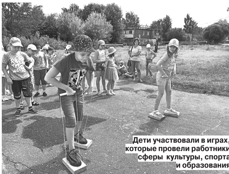
Дети участвовали в играх, которые провели работники сферы культуры, спорта и образования

В лагере кратковременного пребывания Балахонковского сельского дома культуры прошли уроки музыки, географии, химии, ИЗО, математики, литературы и другие. Но были они не такими, как в школе. Например, на уроке литературы ребята не только вспомнили любимые книги, но и примерили на себя образы известных сказочных героев — Снежной королевы, Емели, заморского принца, Вакеры и многих других. А на уроке музыки дети узнали, как называются ноты, познакомились с клавиатурой на синтезаторе и пробовали играть на этом музыкальном инструменте.