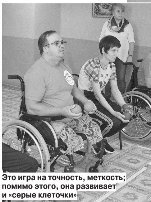
Это игра на точность, меткость; помимо этого, она развивает и «серые клеточки»