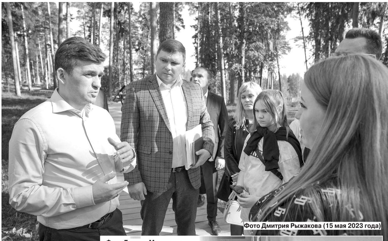
Фото Дмитрия Рыжакова (15 мая 2023 года)

В нашем регионе меры социальной поддержки семей с детьми разнятся. Это касается оплаты пребывания малышей в детском саду. У меня такая ситуация. Я многодетная мать. В нашем дошкольном учреждении 50-процентная оплата за него от-