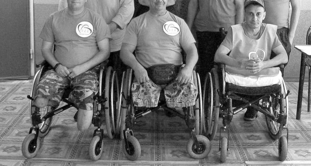
Команда Богородского дома-интерната