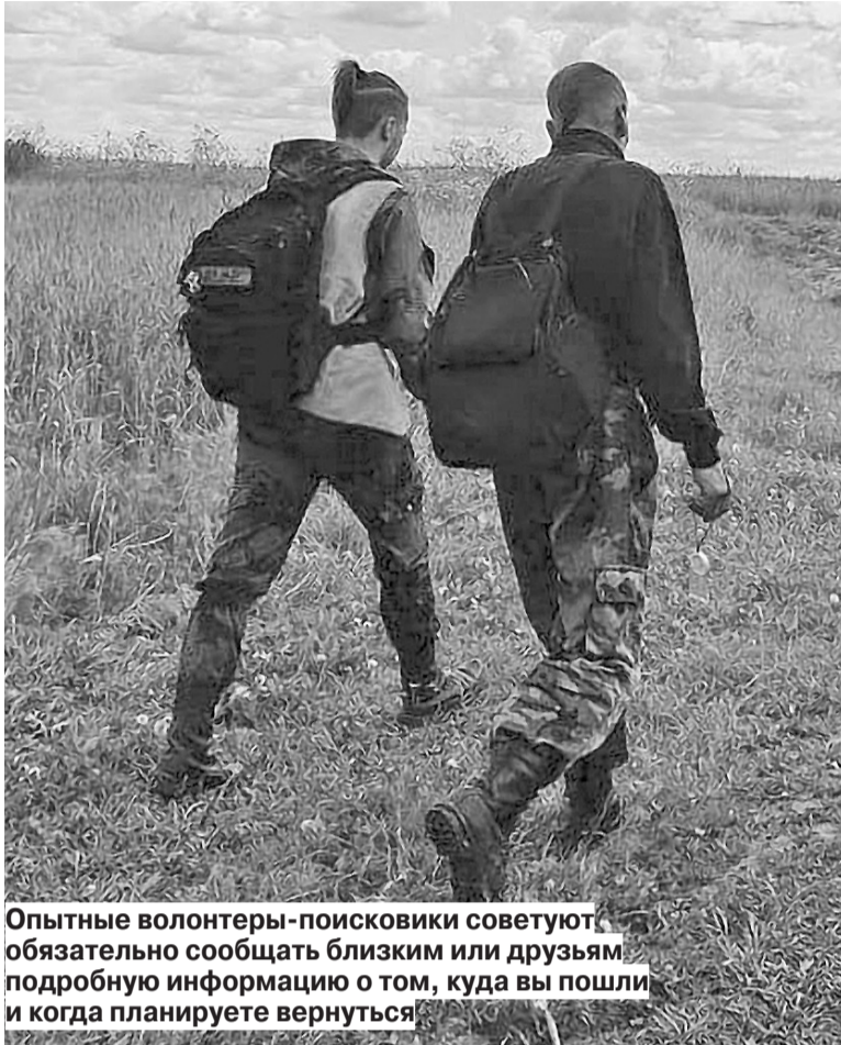
Опытные волонтеры-поисковики советуют обязательно сообщать близким или друзьям подробную информацию о том, куда вы пошли и когда планируете вернуться

Но чаще всего дежурной смене все же приходится выезжать на место происшествя и