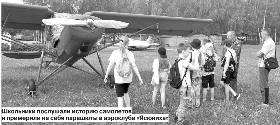
Школьники послушали историю самолетов и примерили на себя парашюты в аэроклубе «Ясюниха»

Подходят к концу вторые летние смены в детских лагерях различного вида. Было много запоминающихся занятий и мероприятий. Дети учились играть на ложках, праздновали День шоколада, осваивали интернет-технологии, «химичили», изучали самолеты и самовары, а в руках у них «оживали» кисточки.