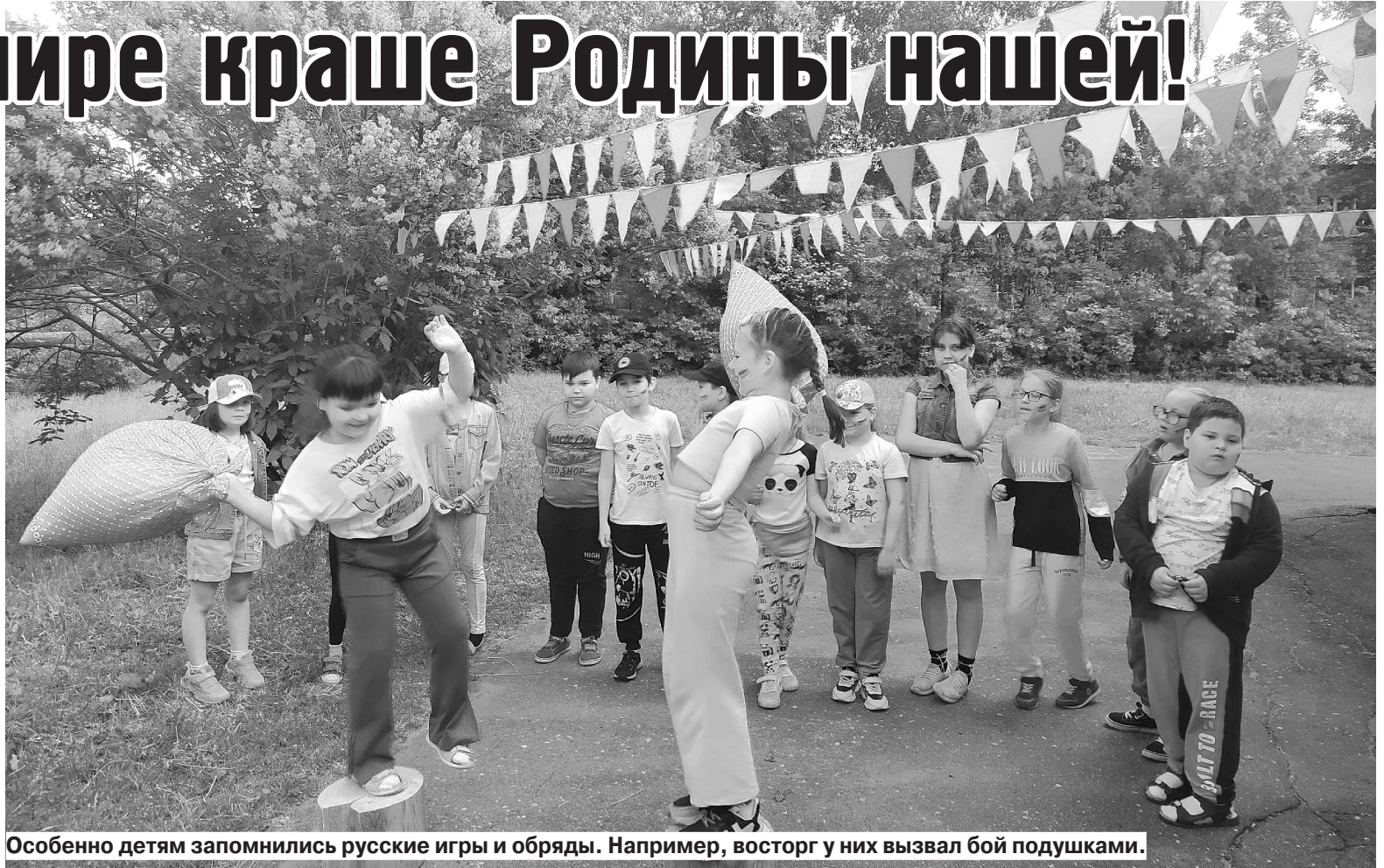
Особенно детям запомнились русские игры и обряды. Например, восторг у них вызвал бой подушками.

Множество мероприятий прошло в библиотеках Ивановского района. Так, в преддверии праздника для юных патриотов нашей страны открыла свои двери Подвязновская сельская библиотека. Здесь состоялась познавательная - игровая программа «Вместе мы - Россия!». В начале мероприятия ре-