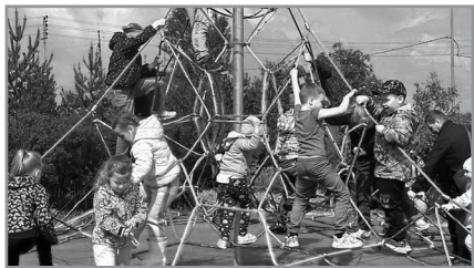
«ПАУТИНКА» - НА РАДОСТЬ ДЕТЯМ