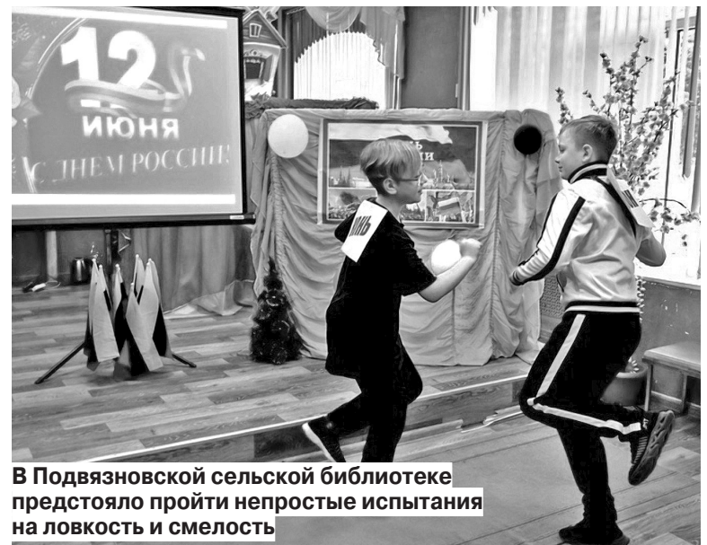
В Подвязновской сельской библиотеке предстояло пройти непростые испытания на ловкость и смелость

Работники Подвязновского сельского дома культуры украсили окна учреждения цветами