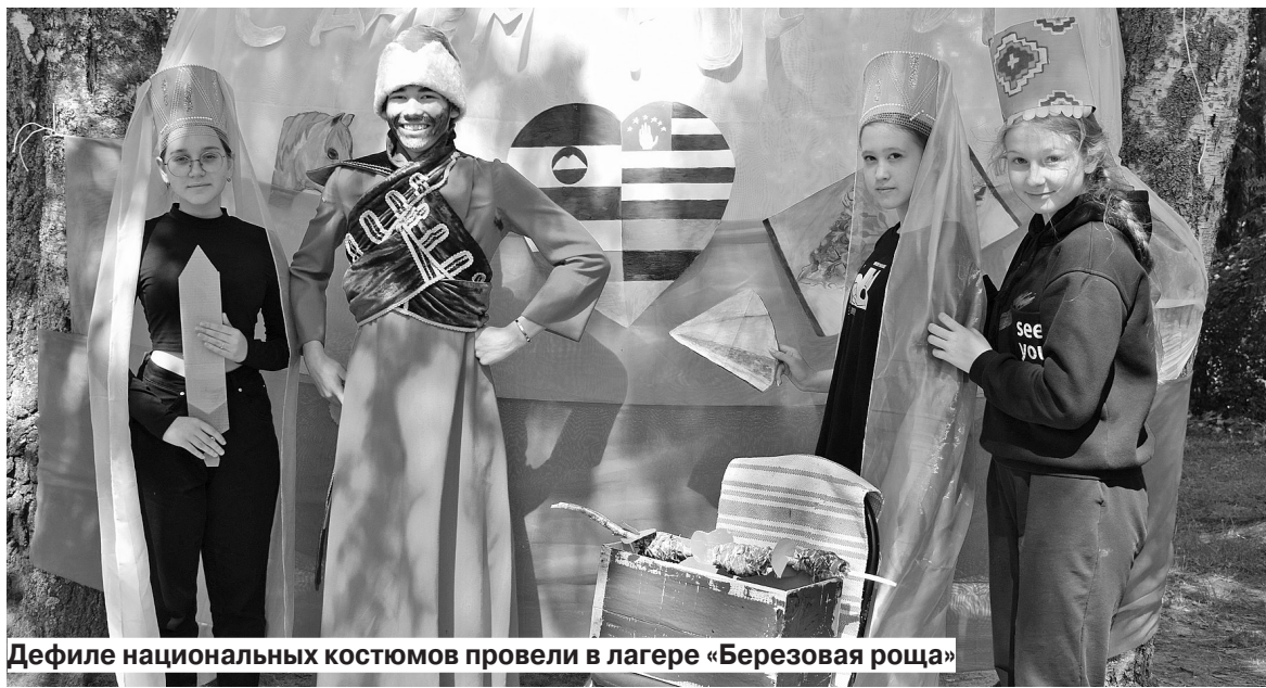
Дефиле национальных костюмов провели в лагере «Березовая роща»

бята познакомились с историей праздника, вспомнили символы нашей страны. Дети также ответили на вопросы викторины, посвященной культуре русского народа, праздникам и обрядам. Ребята отгадывали и героев произведений русских писателей.