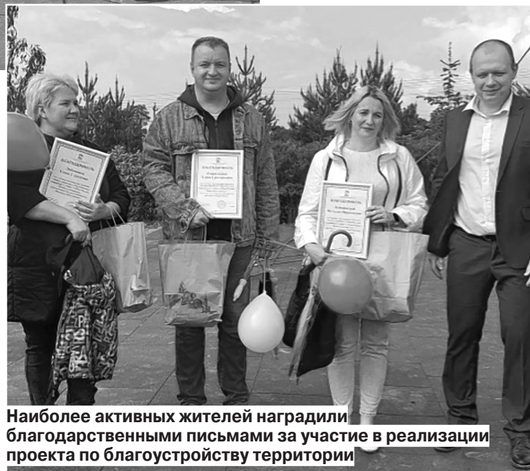
Наиболее активных жителей наградили благодарственными письмами за участие в реализации проекта по благоустройству территории

Школьной пользуется огромной популярностью у местных ребятшек. Я сама мама, поэтому тоже провожу здесь много времени. Мои дети любят бывать на площадке. В детском парке имеется все необходимое: и горки,