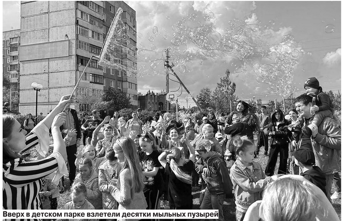
Вверх в детском парке взлетели десятки мыльных пузырей