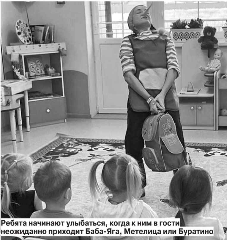
Ребята начинают улыбаться, когда к ним в гости неожиданно приходит Баба-Яга, Метелица или Буратино