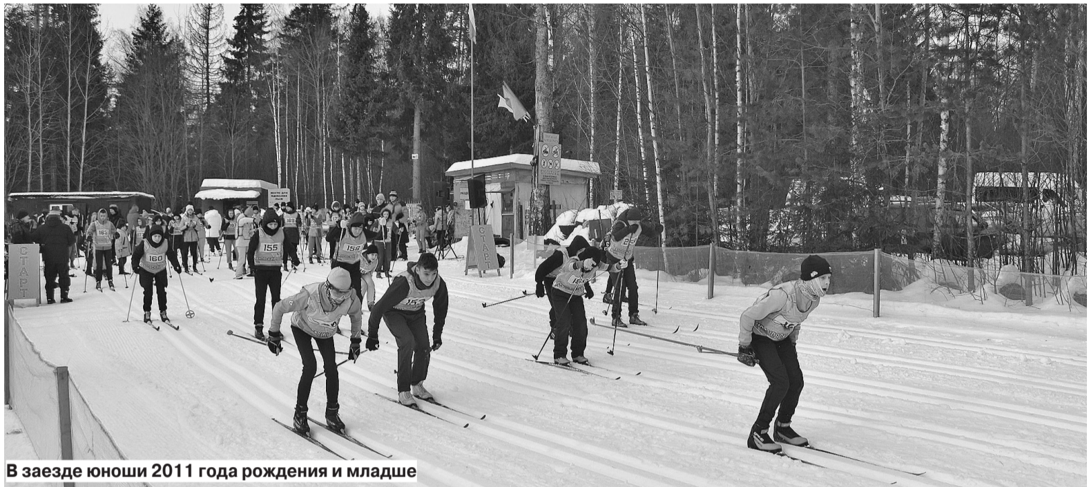
В заезде юноши 2011 года рождения и младше

Участники соревнований показали отличные результаты на