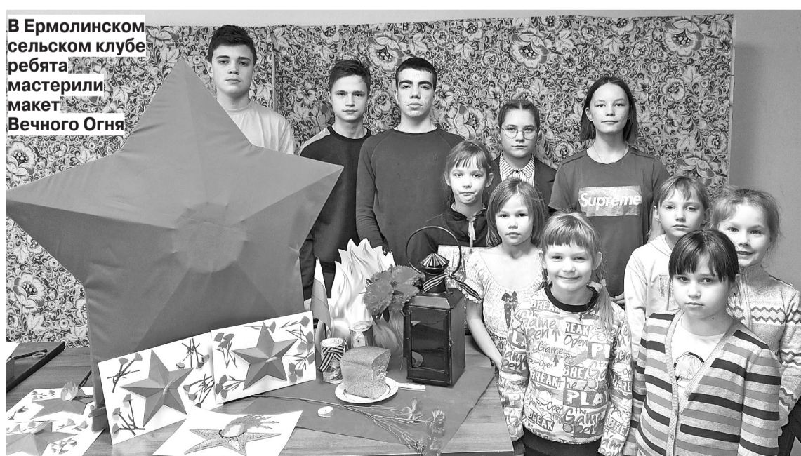
В Ермолинском сельском клубе ребята мастерили макет Вечного Огня