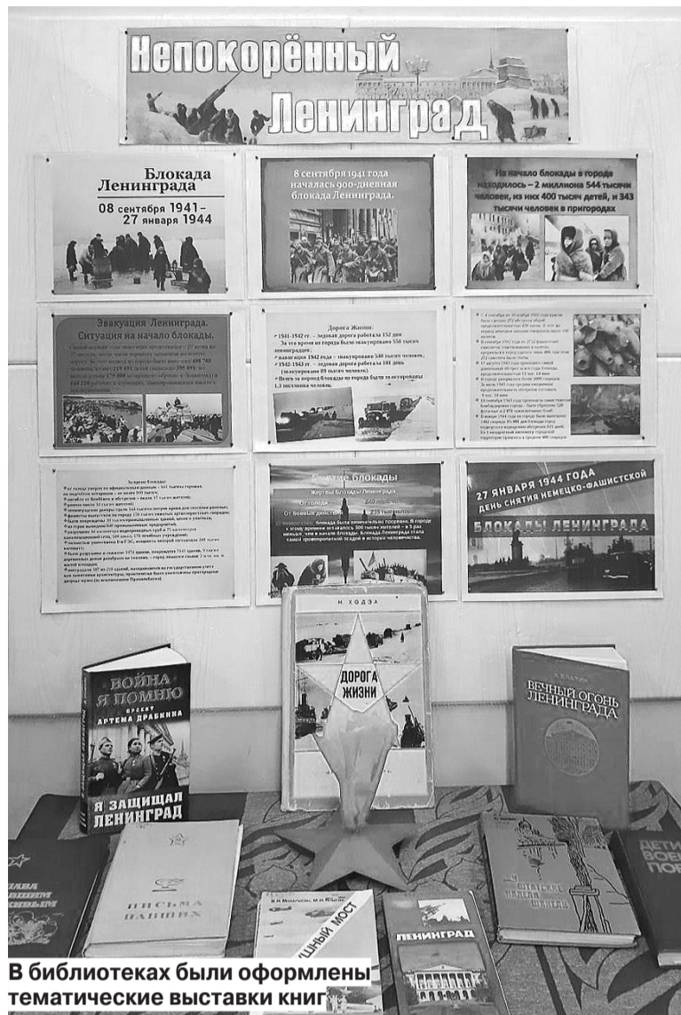
В библиотеках были оформлены тематические выставки книг

Уроки мужества прошли во всех учреждениях образования 27 января. В детских садах ребята смотрели документальные фильмы, старые фотографии, на которых были изображены люди во время блокады. В школах занятия прошли для учеников разного возраста. Так, например, первоклашки из Коляновской средней школы познакомились с частичкой тех дней через виртуальную экскурсию Музея блокады Ленинграда. Больше всего ребятам запомнились бытовые предметы времен войны, военные приспособления и личные вещи жителей города на Неве. В День снятия блокады Ленинграда ребята из волонтерского отряда «Олимп» провели информационный урок в Новоталицкой средней школе. Ученикам пятого класса они рассказали про время, которое стало тяжким испытанием для ленинградцев.