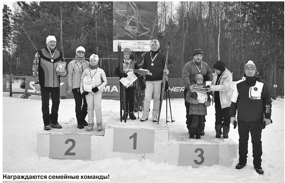
Награждаются семейные команды!