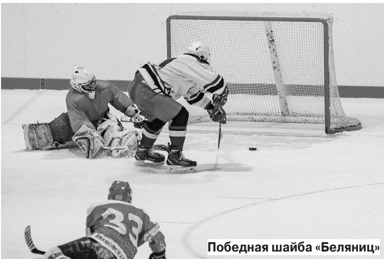
Победная шайба «Беляниц»

Егор ЕМЕЛЬЯНОВ