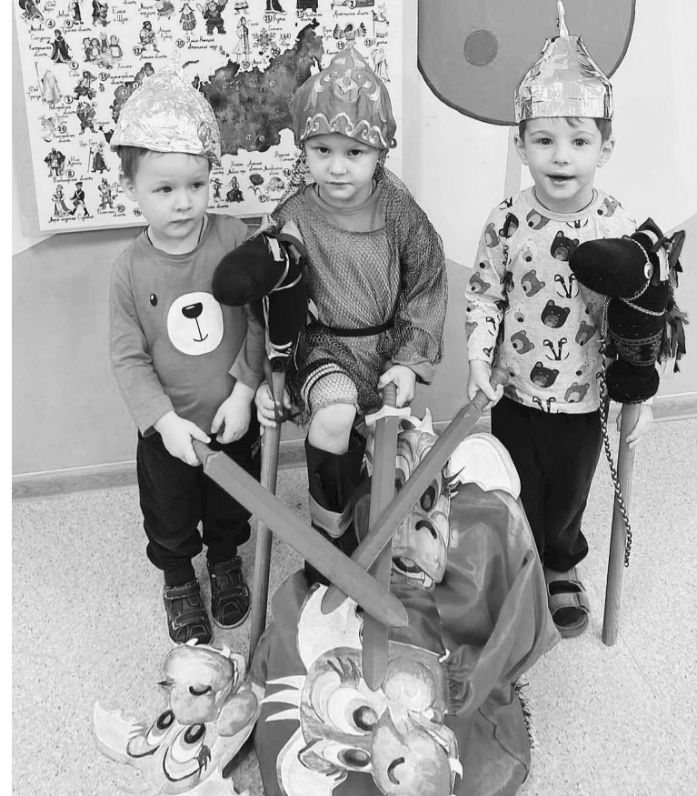
Дети с удовольствием примеряют на себя образы и костюмы различных персонажей