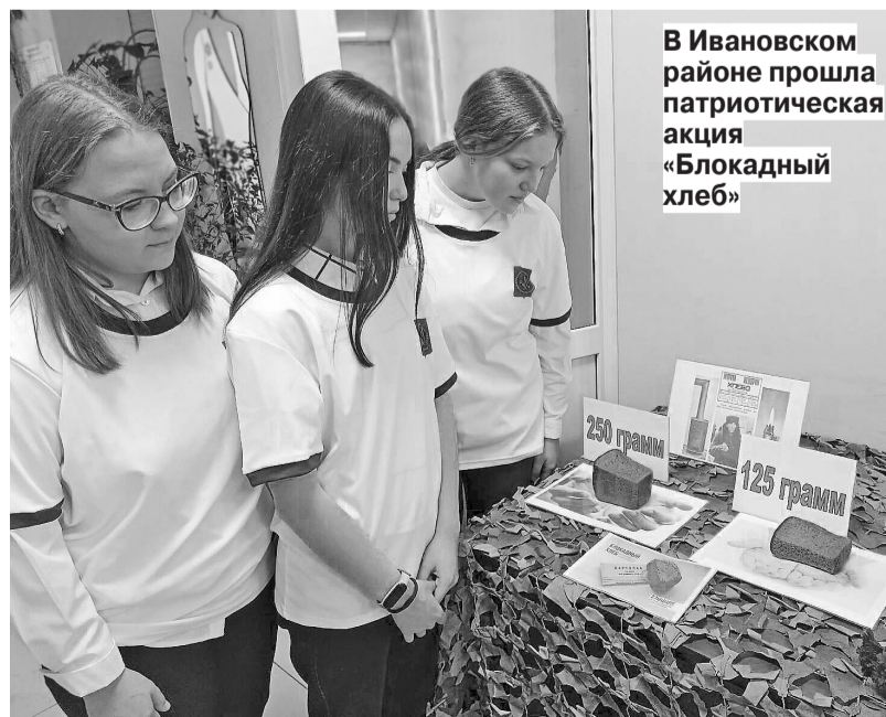
В Ивановском районе прошла патриотическая акция «Блокадный хлеб»