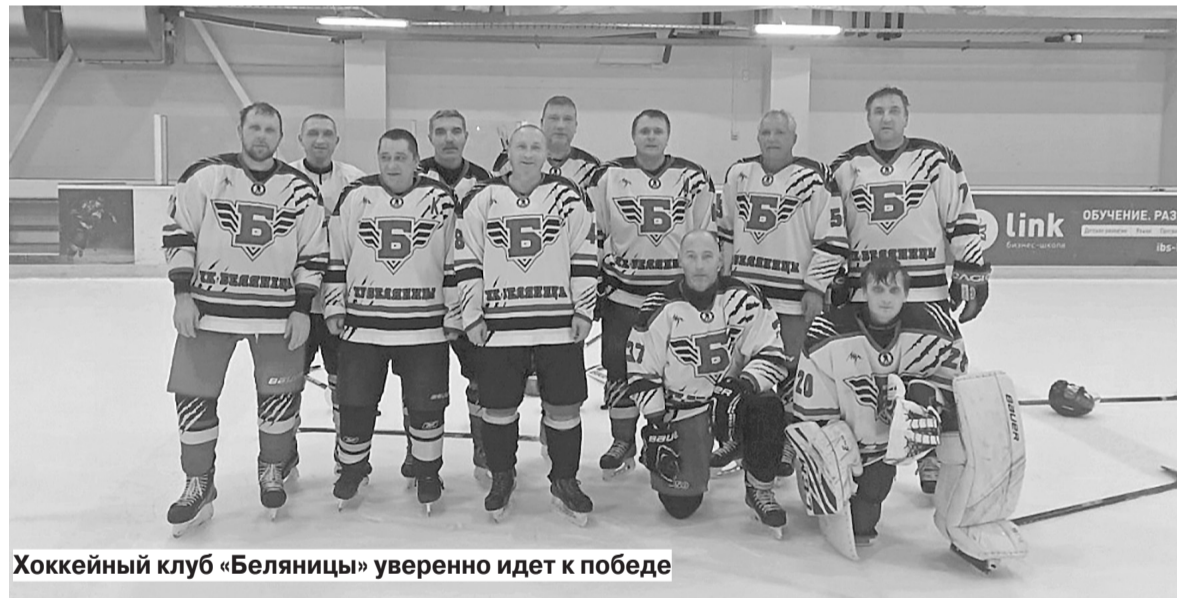
Хоккейный клуб «Беляницы» уверенно идет к победе

Жители Беляницкого сельского поселения и Ивановского района в целом активно поддерживают команду на нынешних играх. Теплые слова поддержки команде высказала глава Беляницкого сельского поселения