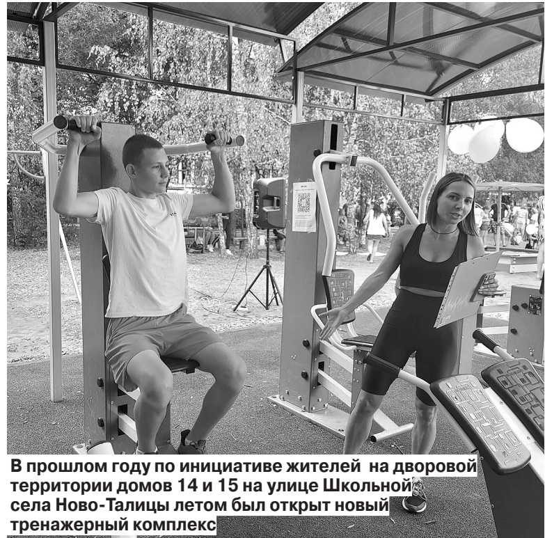
В прошлом году по инициативе жителей на дворовой территории домов 14 и 15 на улице Школьной села Ново-Талицы летом был открыт новый тренажерный комплекс