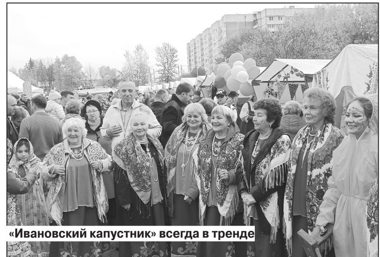
«Ивановский капустник» всегда в тренде