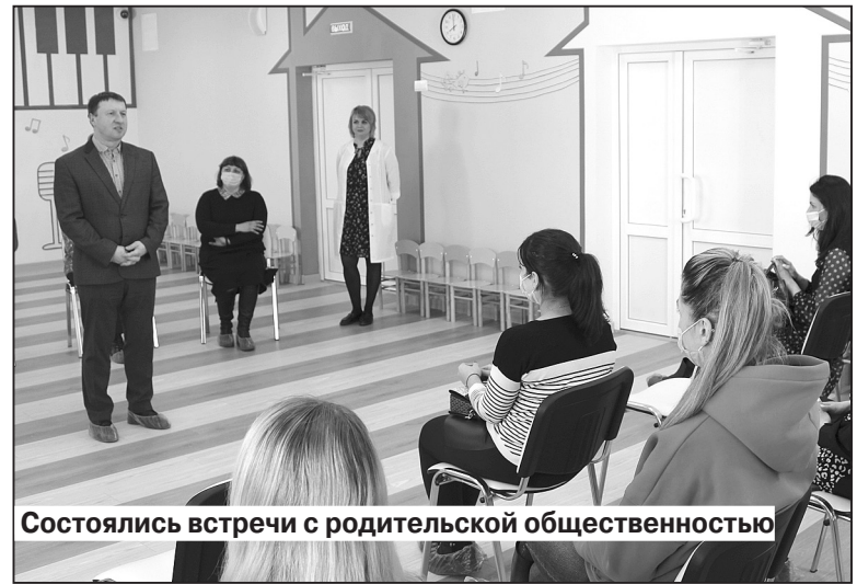
Состоялись встречи с родительской общественностью