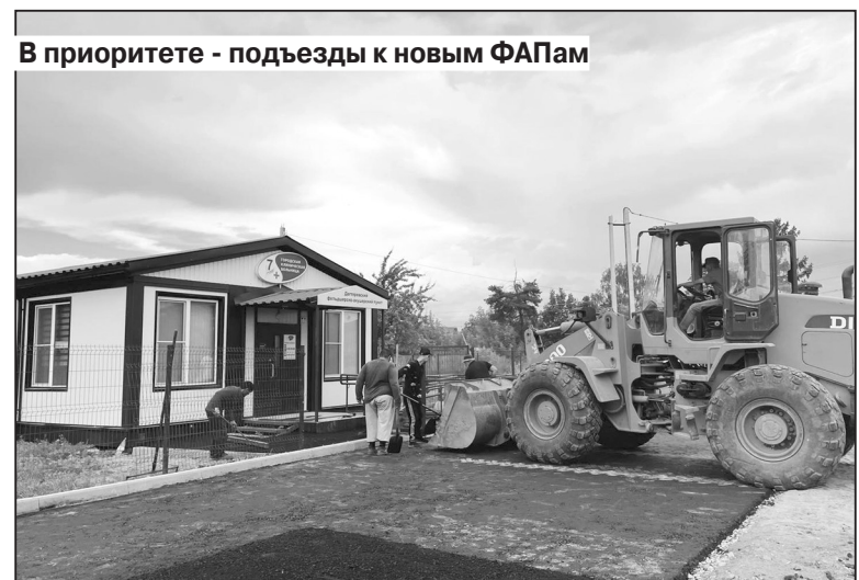
В приоритете - подъезды к новым ФАПам