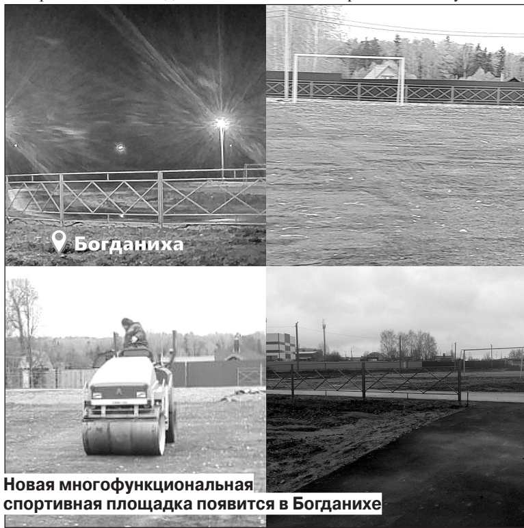
Новая многофункциональная спортивная площадка появится в Богданихе