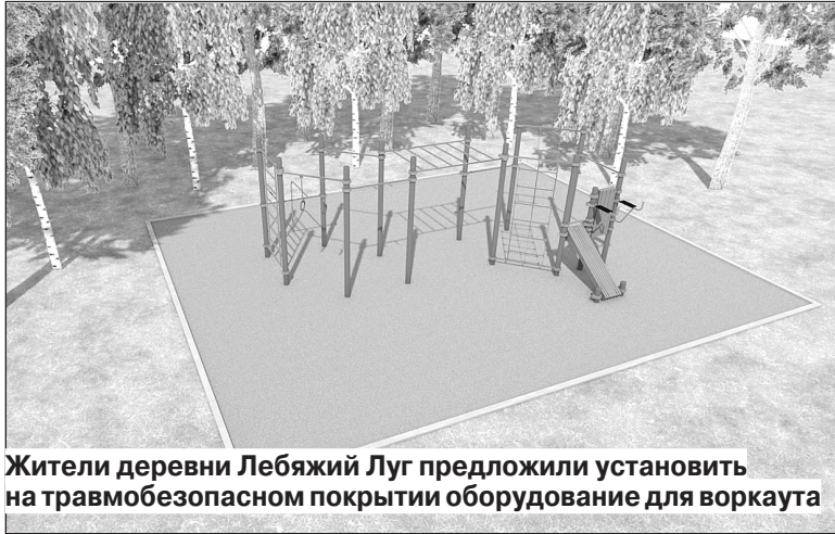
Жители деревни Лебяжий Луг предложили установить на травмобезопасном покрытии оборудование для воркаута

Жители деревни Лебяжий Луг предложили установить на травмобезопасном покрытии оборудование для воркаута. Спортивные элементы планируют разместить у детской площадки в районе домов № 6 и № 7.