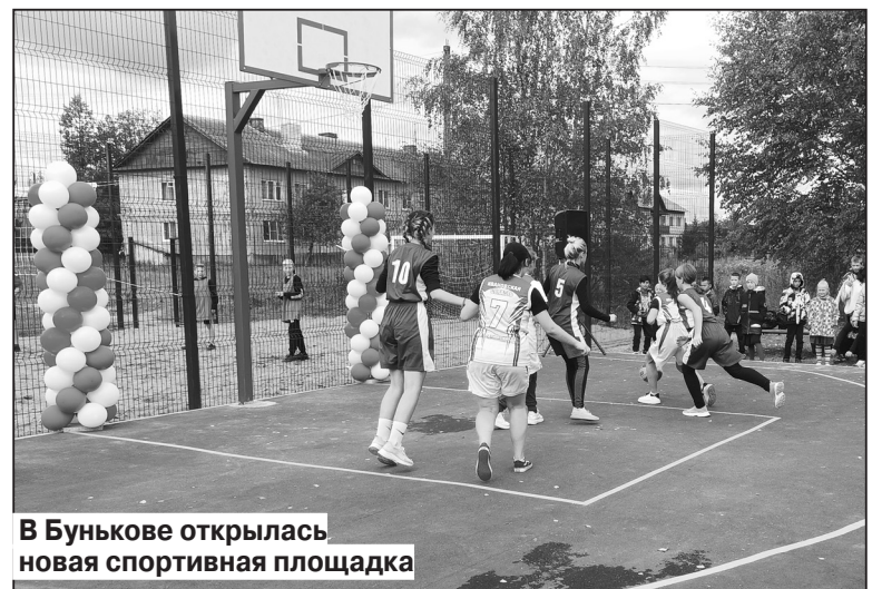
В Бунькове открылась новая спортивная площадка