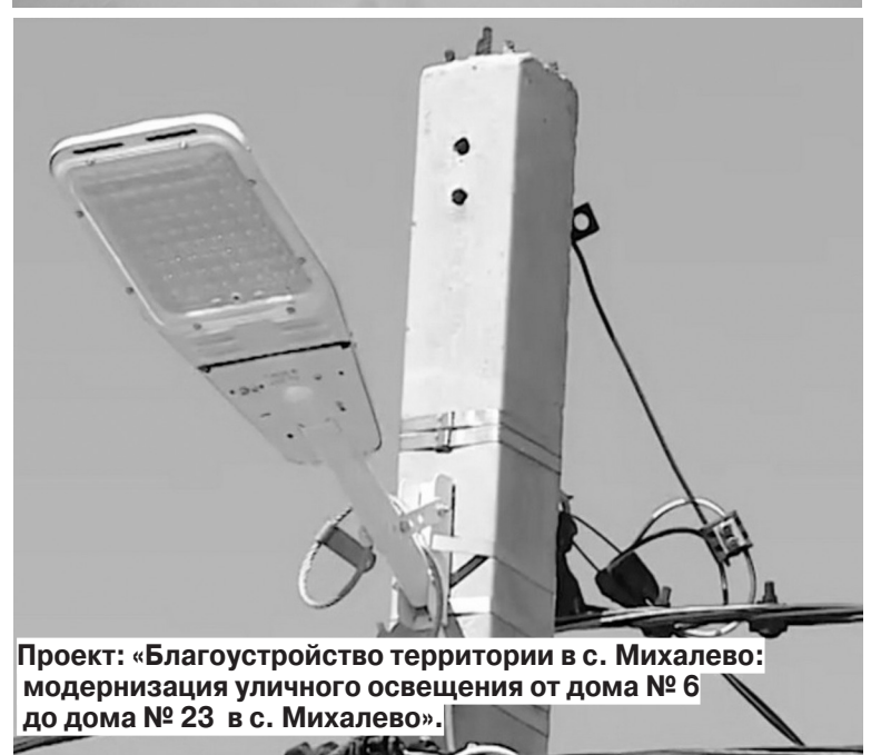
Проект: «Благоустройство территории в с. Михалево: модернизация уличного освещения от дома № 6 до дома № 23 в с. Михалево».