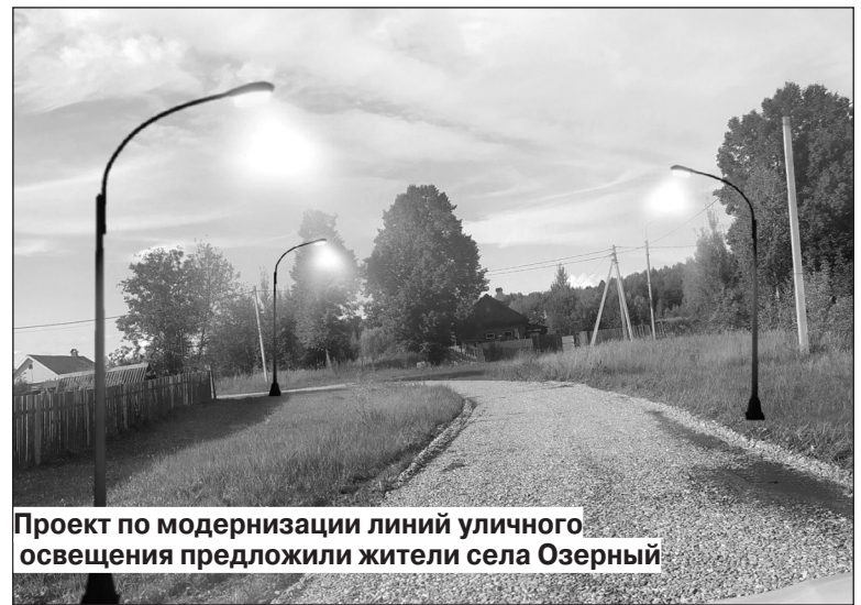
Проект по модернизации линий уличного освещения предложили жители села Озерный

Проект по модернизации линий уличного освещения с увеличением количества фонарей на существующей сети на улицах Рабочая, Западная, Южная и