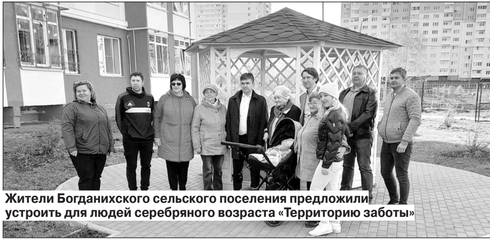
Жители Богданихского сельского поселения предложили устроить для людей серебряного возраста «Территорию заботы»