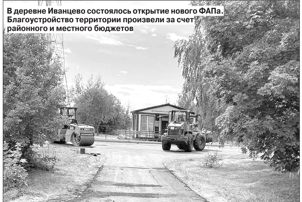
В деревне Иванцево состоялось открытие нового ФАПа. Благоустройство территории произвели за счет районного и местного бюджетов