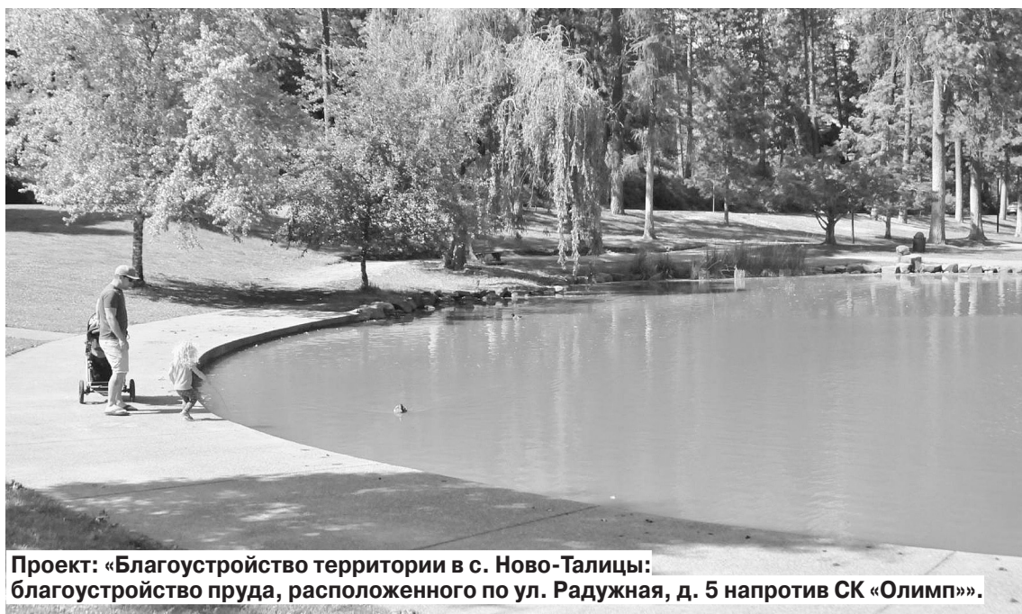
Проект: «Благоустройство территории в с. Ново-Талицы: благоустройство пруда, расположенного по ул. Радужная, д. 5 напротив СК «Олимп»».