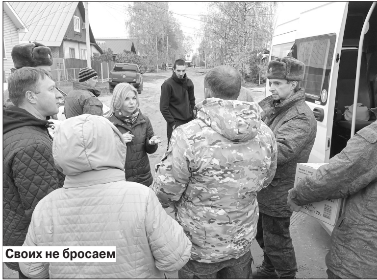
Своих не бросаем