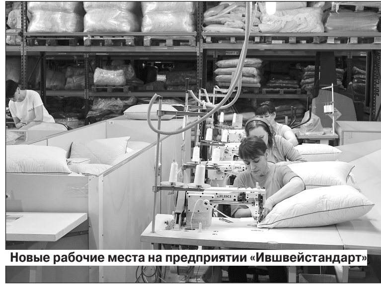
Новые рабочие места на предприятии «Ившвейстандарт»

- Да, при поддержке сельхозпроизводителей это приоритет. Мы продолжаем на