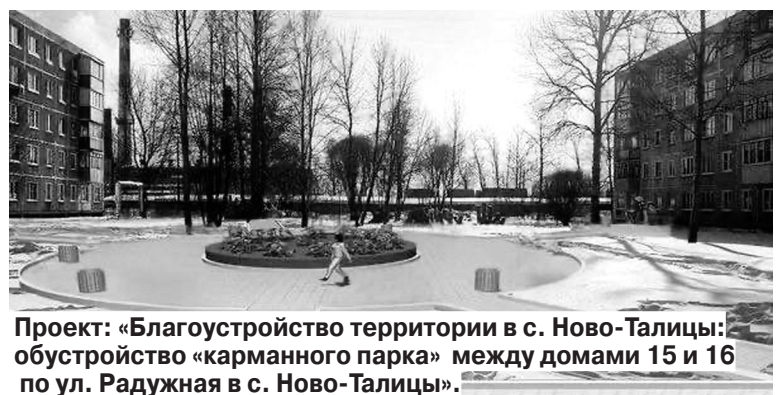
Проект: «Благоустройство территории в с. Ново-Талицы: обустройство «карманного парка» между домами 15 и 16 по ул. Радужная в с. Ново-Талицы».