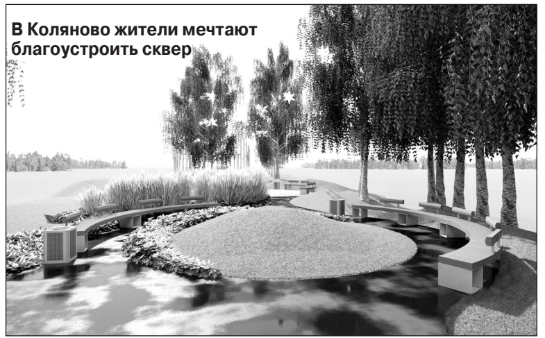
В Коляново жители мечтают благоустроить сквер

- Своими силами сделать не получилось - большую сумму не собрать. В итоге решили принять участие в конкурсе местных