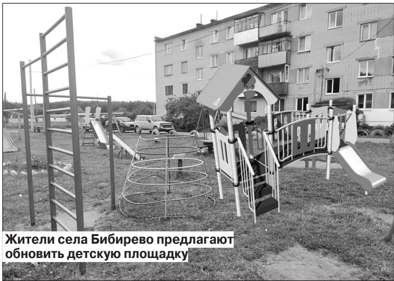
Жители села Бибирево предлагают обновить детскую площадку