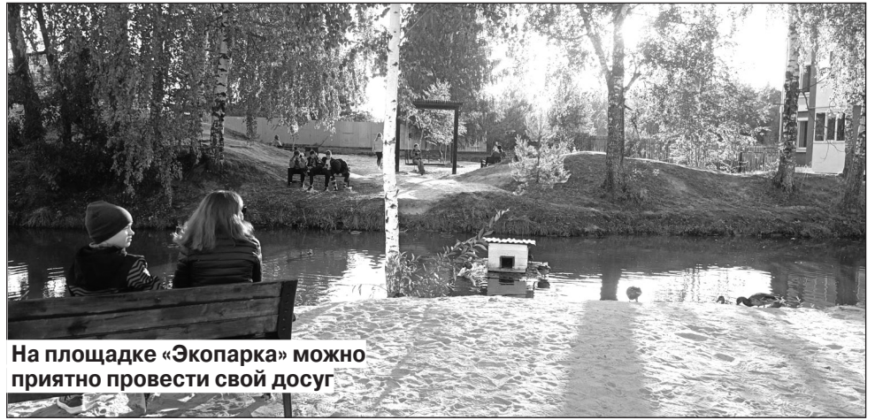
На площадке «Экопарка» можно приятно провести свой досуг