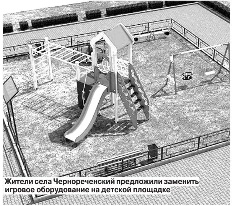
Жители села Чернореченский предложили заменить игровое оборудование на детской площадке