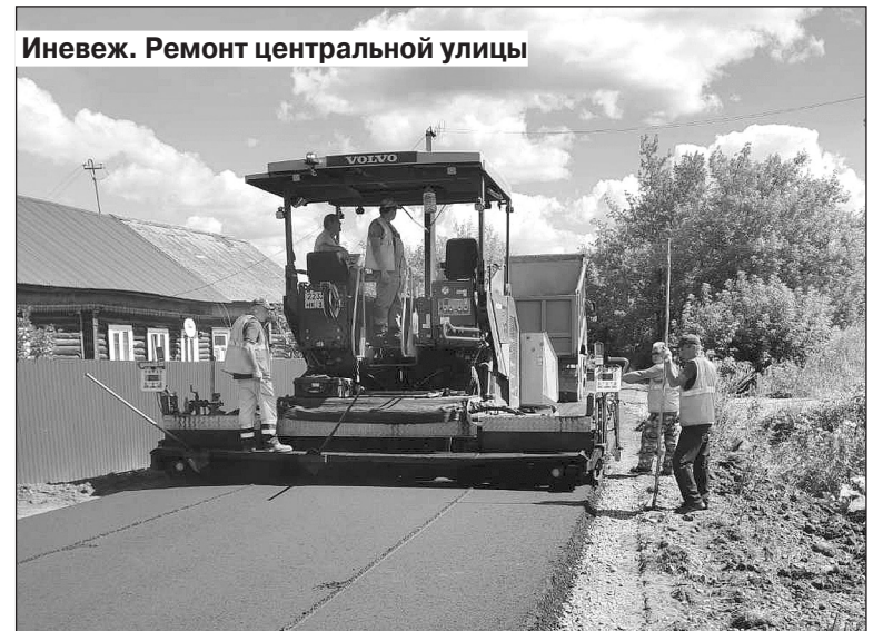
Иневеж. Ремонт центральной улицы