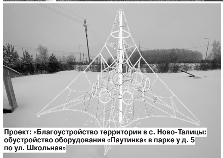
Проект: «Благоустройство территории в с. Ново-Талицы: обустройство оборудования «Паутинка» в парке у д. 5 по ул. Школьная»