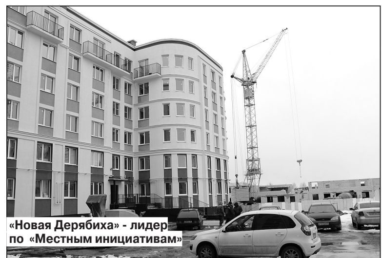
«Новая Дерябиха» - лидер по «Местным инициативам»