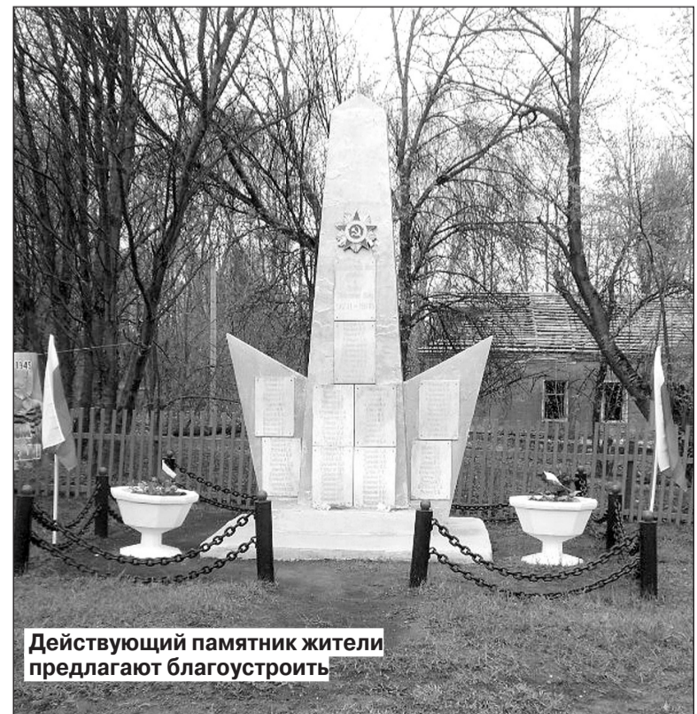
Действующий памятник жители предлагают благоустроить

- Для людей это проект, который они бы хотели реализовать