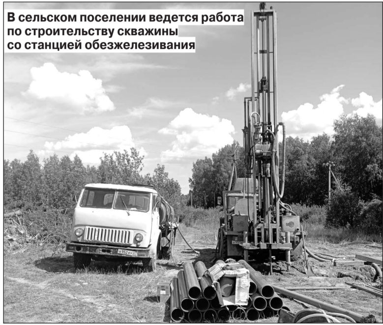
В сельском поселении ведется работа по строительству скважины со станцией обезжелезивания