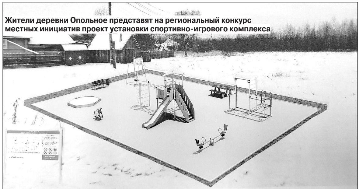
Жители деревни Опольное представят на региональный конкурс местных инициатив проект установки спортивно-игрового комплекса

В первую очередь жители мечтают заменить деревянное ограждение вокруг памятника и флаштки, выложить площадку