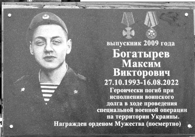
Награжден орденом Мужества (посмертно)