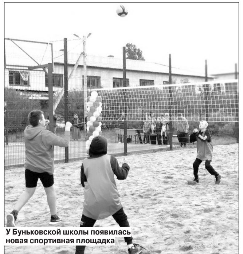
У Буньковской школы появилась новая спортивная площадка