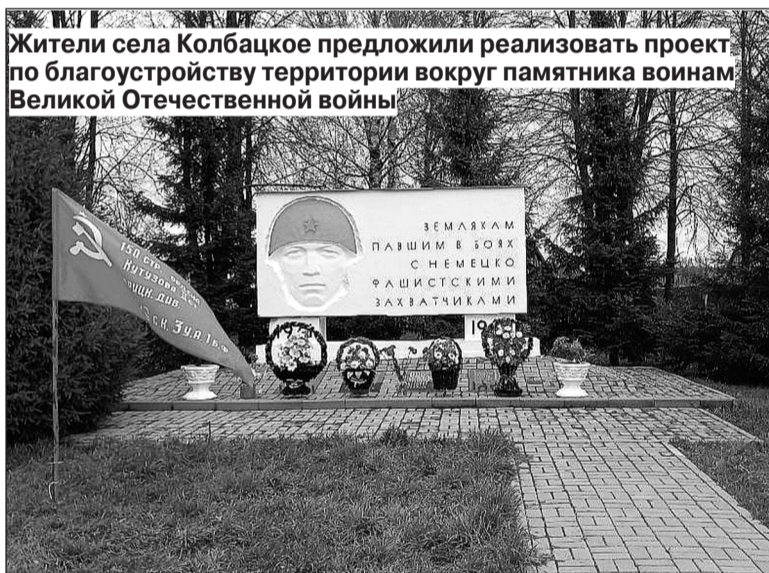
Жители села Колбацкое предложили реализовать проект по благоустройству территории вокруг памятника воинам Великой Отечественной войны