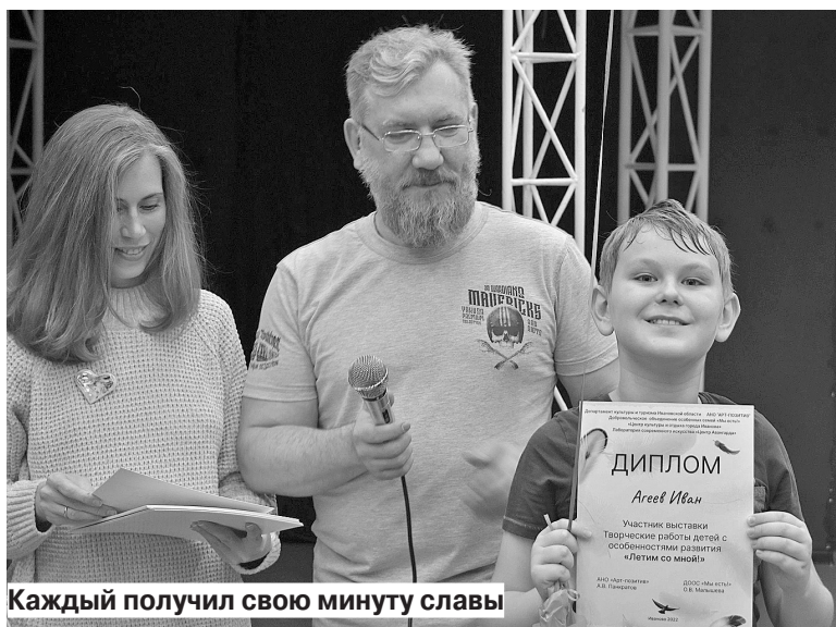
Каждый получил свою минуту славы

Делали все это либо на картоне, либо на блюдах. На поверхности для рисунка наметили количество частей, на которых будут цвета, необходимые в картине. В каждой, как уточняет представитель объединения, не более 5-6 цветов. Вливали в эти части краски «немного хаотично», без определенной последовательности, никто не знал, какой в итоге выйдет результат. Потом феном просушивали саму картину и тем самым фиксировали очертания рисунка. Каждый также добавлял от себя какой-то декоративный элемент, например, натуральный камень.