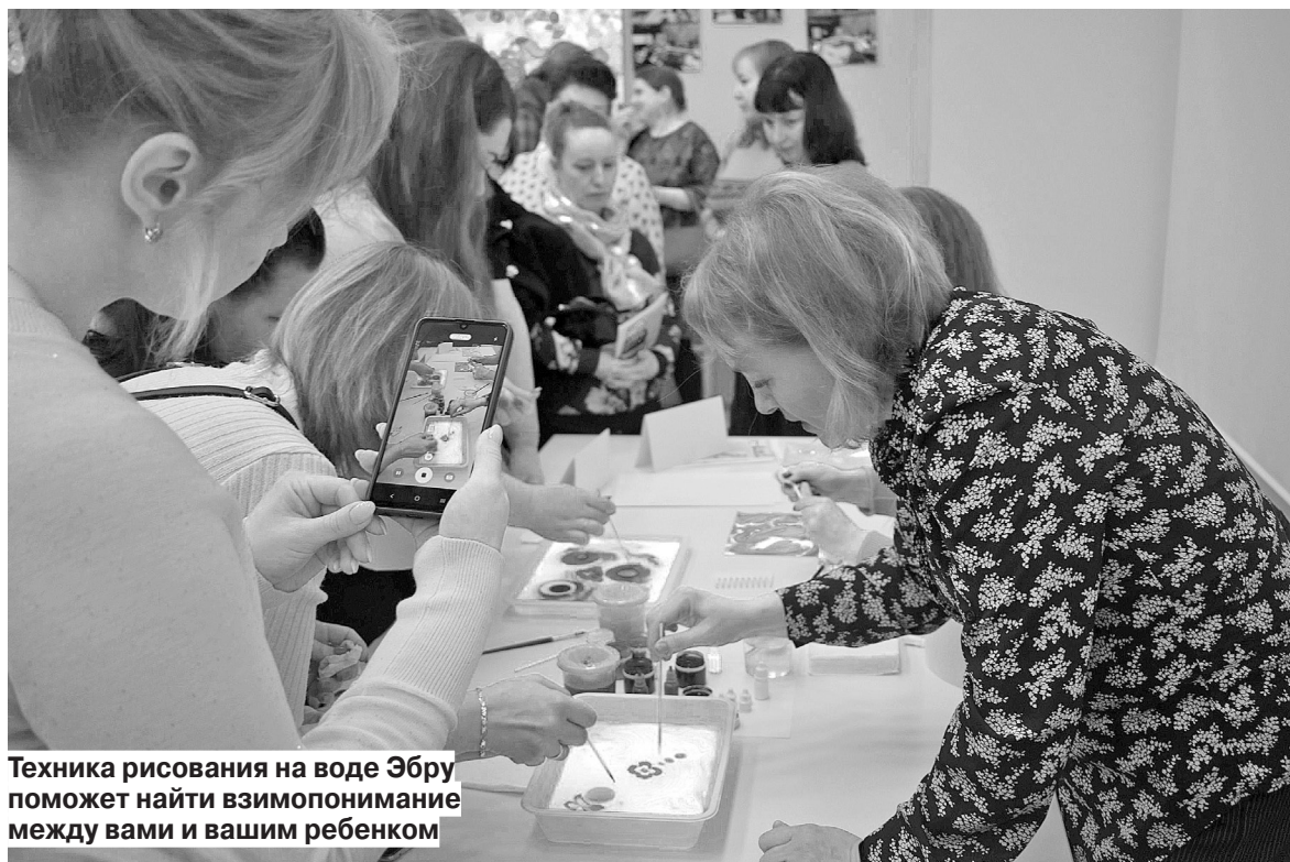
Техника рисования на воде Эбру поможет найти взаимопонимание между вами и вашим ребенком

С докладом на тему «Основные направления воспитательной