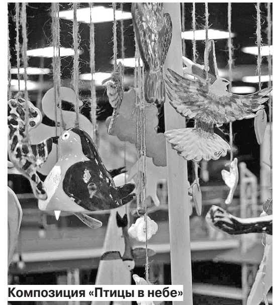
Композиция «Птицы в небе»