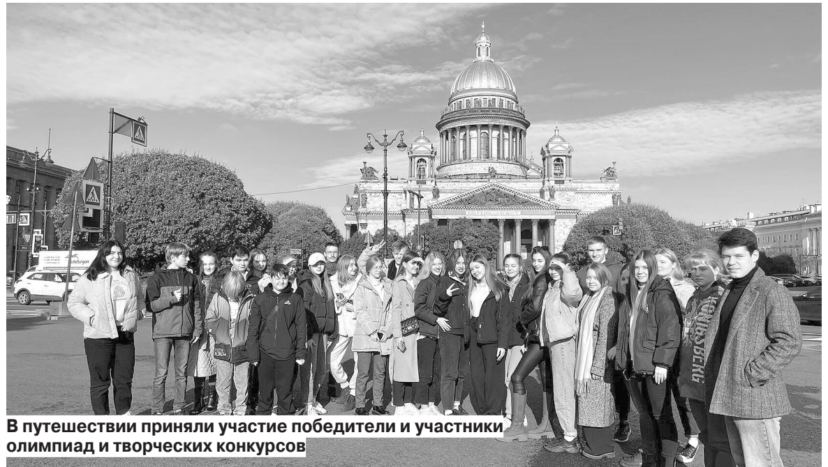
В путешествии приняли участие победители и участники олимпиад и творческих конкурсов

- Это моя вторая поездка в город на Неве. Особенно запомнилась обзорная экскурсия по городу, прогулка по живописному Нижнему парку. Произвел впечатление и музей «Государственные потехи». В нем нам рассказали и показали, как в Петергофе проходили праздники. Также интересно было пообщаться с