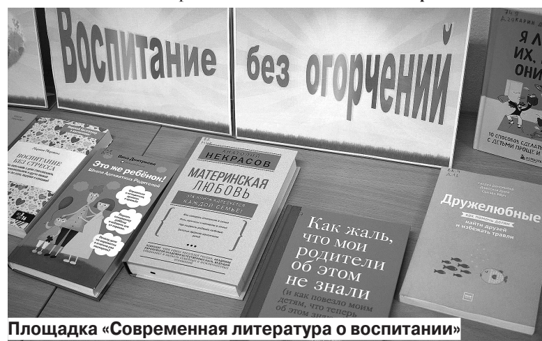
Площадка «Современная литература о воспитании»