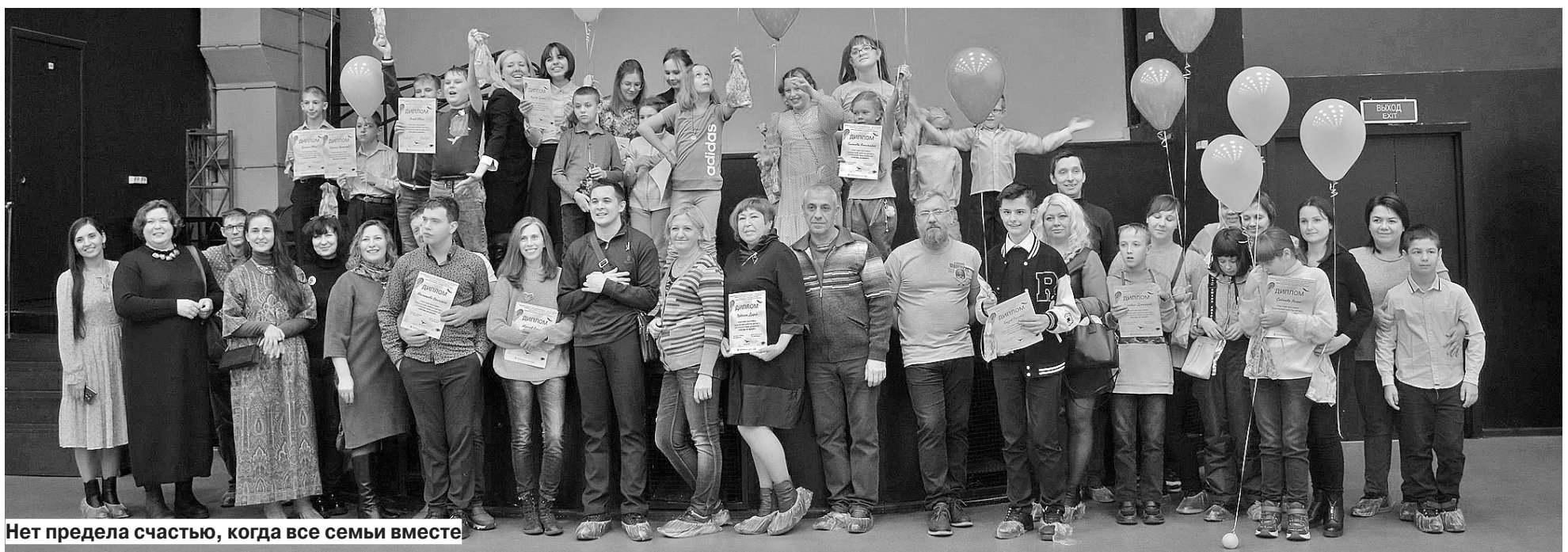
Нет предела счастью, когда все семьи вместе