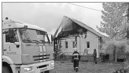
КАК ПОМОГАЮТ ПОГОРЕЛЬЦАМ, ОСТАВШИМСЯ БЕЗ ЖИЛЬЯ